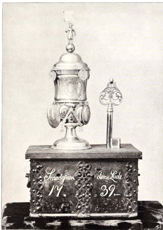
Svendenes Lade 1739. Svendenes Sølvvelkomst fra 1739. En Sølvnøgle til Fanen.