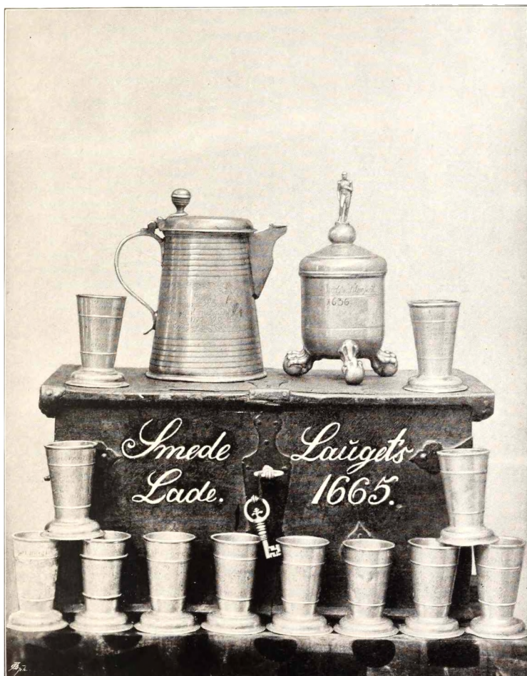
Mestrenes Lade fra 1665. Svendenes Tinselkomst fra 1636. 12 Tinbægere fra 1710. 1 Tin-Ølkande, Aarstallet 1779.