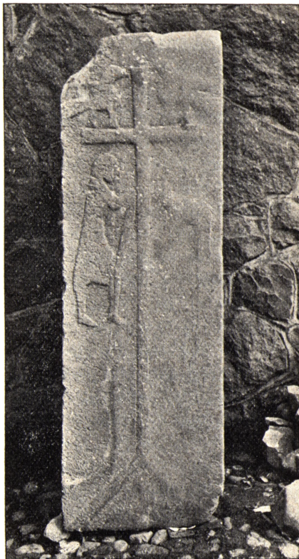
Romansk Ligsten fra det 12. Aarhundrede.