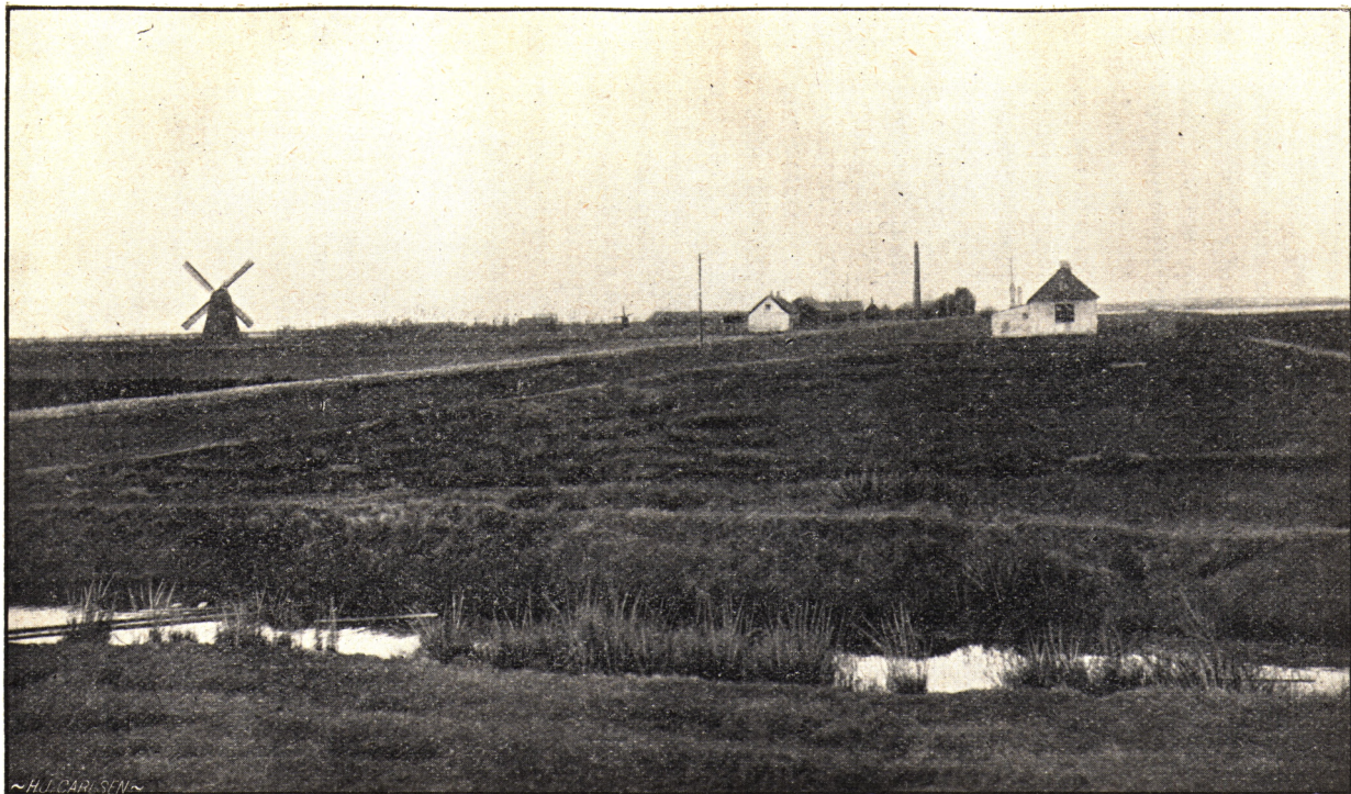
Fra Bygholms Vejle.