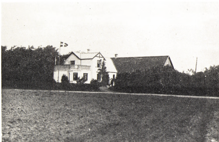
Huset i Aale efter Ombygningen 1915.

drig har vi været gladere, end naar vi har haft den Slags Besøg, og endnu følger vi paa vore gamle Dage Husmandsforeningernes Arbejde og ikke mindst Husmandsrejserne med Interesse. Det har haft saa meget at betyde for os, det har haft saa meget at betyde for mange andre, og vil betyde mere for flere. Meget har vi haft at takke Husmandsbevægelsen for i disse vanskelige Tider; og vil den fortsætte i samme Spor, tager jeg ikke i Betænkning at spaa den en lang og frugtbar Levetid.