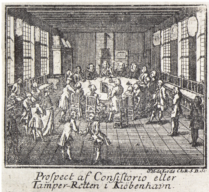
Konsistorium fungerende som Tamperret 1754.

Da Holberg avancerede til at faa Sæde i Konsistorium, blev han dermed Assessor i Konsistoriums Domstol. Konsistorium var den Gang en Forgrening af Domsmagten. Ligesom de fleste andre Institutioner af Betydning havde ogsaa Universitetet sin egen Juris-