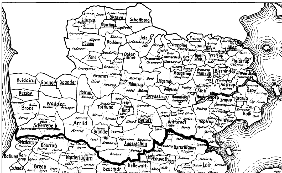
Kort over vejkommuner i Haderslev kreds 1867-1920. I de tilfælde, hvor navnet på sognet er understreget, var vejkommunens/vejforbundets administrative grænser sammenfaldende med sognets. I alle andre tilfælde var vejkommunens administrative grænser sammenfaldende med den langt mindre landkommune.

området således: Den udvikling af Kommunernes Vejnet, som Nord for Kongeaen har fundet Sted samtidig med Jordens Fordeling, har mange Steder i Sønderjylland intet Sidestykke. Bortset fra de gamle Hovedveje og de efter Genforeningen udbyggede nye Veje er Vejene i Sønderjylland hyppigt tarvelige Markveje el. lign., der straa-ler ud fra Landsbyerne og oftest ender blindt uden Forbindelse med Vejene i andre Kommuner. 25 Hele det sønderjyske bivejsnet var ved Genforeningen ikke alene dårligt og nedslidt, det var også strukturelt forældet i forhold til de samfundsmæssige ændringer, der havde fundet sted siden udskiftningerne.