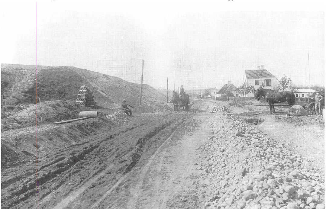
Anlæggelsen af en ny vej i Dover, Lintrup sogn i Haderslev. Billedet er udateret, men formentlig taget efter Genforeningen.