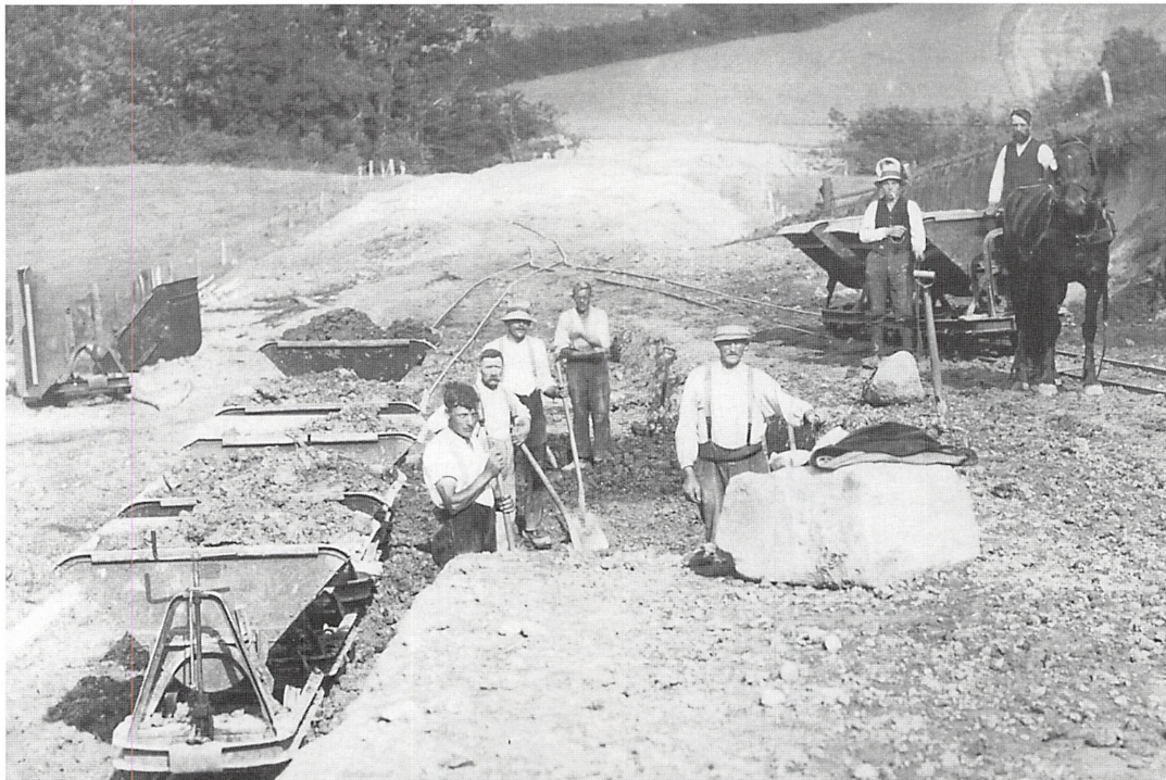
Anlæggelsen af »Minutvejen« i Ensted sogn ca. 1935. Vejen indgik som en del af den store vejplan for udbygningen af landevejene i Sønderjylland, som Ministeriet for offentlige Arbejder og de sønderjyske amter aftalte i 1921. Det kryptiske navn fik vejen af lokalbefolkningen, som mente, at der nok blev anvendt lidt rigeligt med penge på en vej, der kun gav en minimal besparelse i rejsetiden. Ikke desto mindre var det veje som denne, der efter Genforeningen bidrog til at gøre mange af de snoede kommuneveje overflødige.

flødige for de langt større danske sognekommuner.