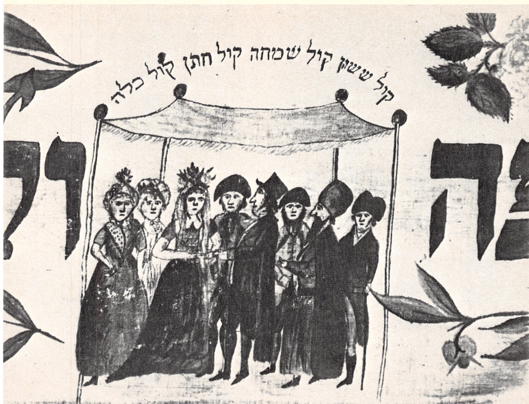
Vimpel fra 1800-tallets begyndelse. Scenen viser et bryllup. Proveniensen: Mosaik Troessamfund i København.

kaldte »unge Tyskland«, hvor en gruppe af radikale digtere opponerede mod det tyske samfunds urimeligheder. Blandt denne gruppe fandtes et betydeligt antal jødiske skribenter, hvoraf Ludwig Börne og Heinrich Heine bør nævnes.