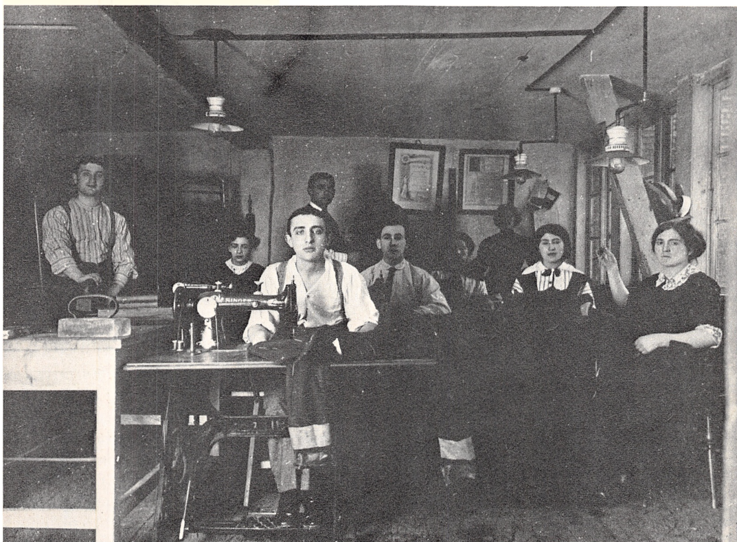
Jødisk skrædderi i Studiestræde fra ca. 1918.