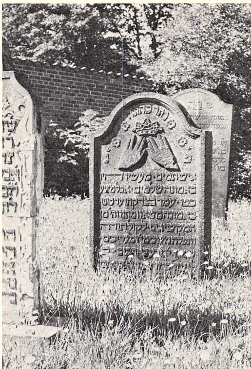
Gravsten fra Fredericia Kirkegård.