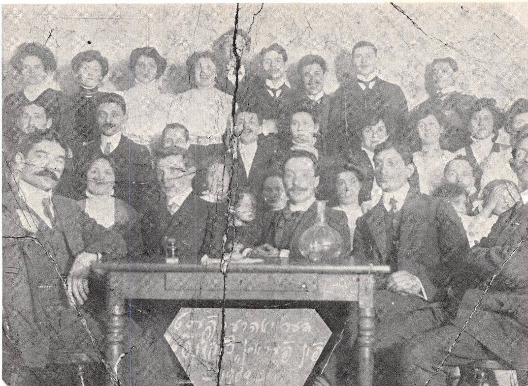
Bundister i København 1909. Bund var den socialistiske jødiske arbejderbevægelse, der spillede en vigtig rolle i socialistisk internationale. Da leninisterne overtog magten i Rusland blev bevægelsen hurtig undertrykt. I Danmark spillede Bund en afgørende rolle i immigranternes faglige organisering.

dels på grund af sociale og kulturelle forskelle, men også fordi de herboende familier følte sig meget danske og ikke ønskede at blive identificeret med disse udenlandske proletarer. Der er skrevet meget lidt om de russisk-polske immigranternes liv i København. De bosatte sig under ghettolignende forhold i bl.a. Borgergade, Adelgade og Prindsensgade. Her boede de tæt sammen, talte jiddish indbyrdes og opretholdt i det hele taget det jiddiske miljø. I tidsskriftet for Selskabet for dansk jødisk historie har denne forskningsoversigts forfatter skrevet en række artikler, hvor bl.a. immigranternes fagforeningsforhold og teatermiljø er blevet beskrevet. Cordt Trap har udarbejdet en sociologisk undersøgelse over immigranternes antal, boligforhold og erhverv. Denne undersøgelse er at finde i Tidsskrift for