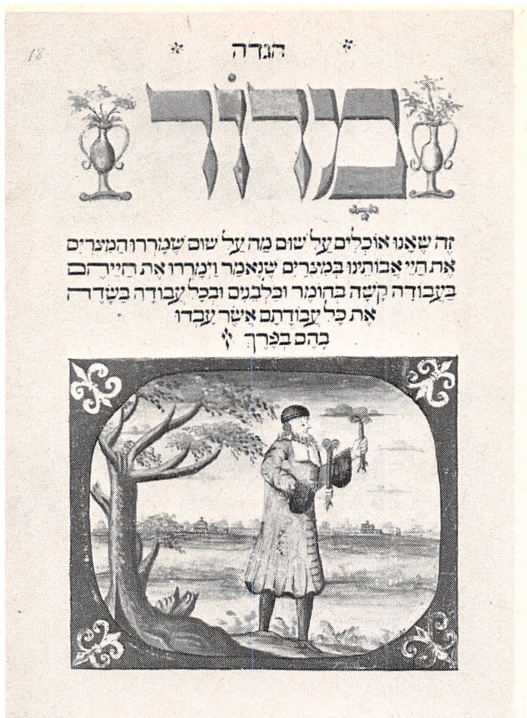
Haggada 1741. Proveniensen: Mosaik Troessamfund i København.

ubenyttet kildemateriale. Men ødelæggelsen af arkivet før 1807 betyder, at en nøjere beskrivelse af de interne menighedsforhold i 1600- og 1700-tallet for Københavns vedkommende er vanskeliggjort. Dog er der en hel del at hente i såvel Rigsarkivet som Landsarkiverne, fordi mange interne jødiske stridigheder gik til de offentlige myndigheders afgørelse. Men beskrivelsen af dansk-jødiske forhold kan også baseres på en række andre kildegrupper som f.eks. gravsten, der ofte indeholder en lang række oplysninger om afdødes afstamning og levnedsløb.