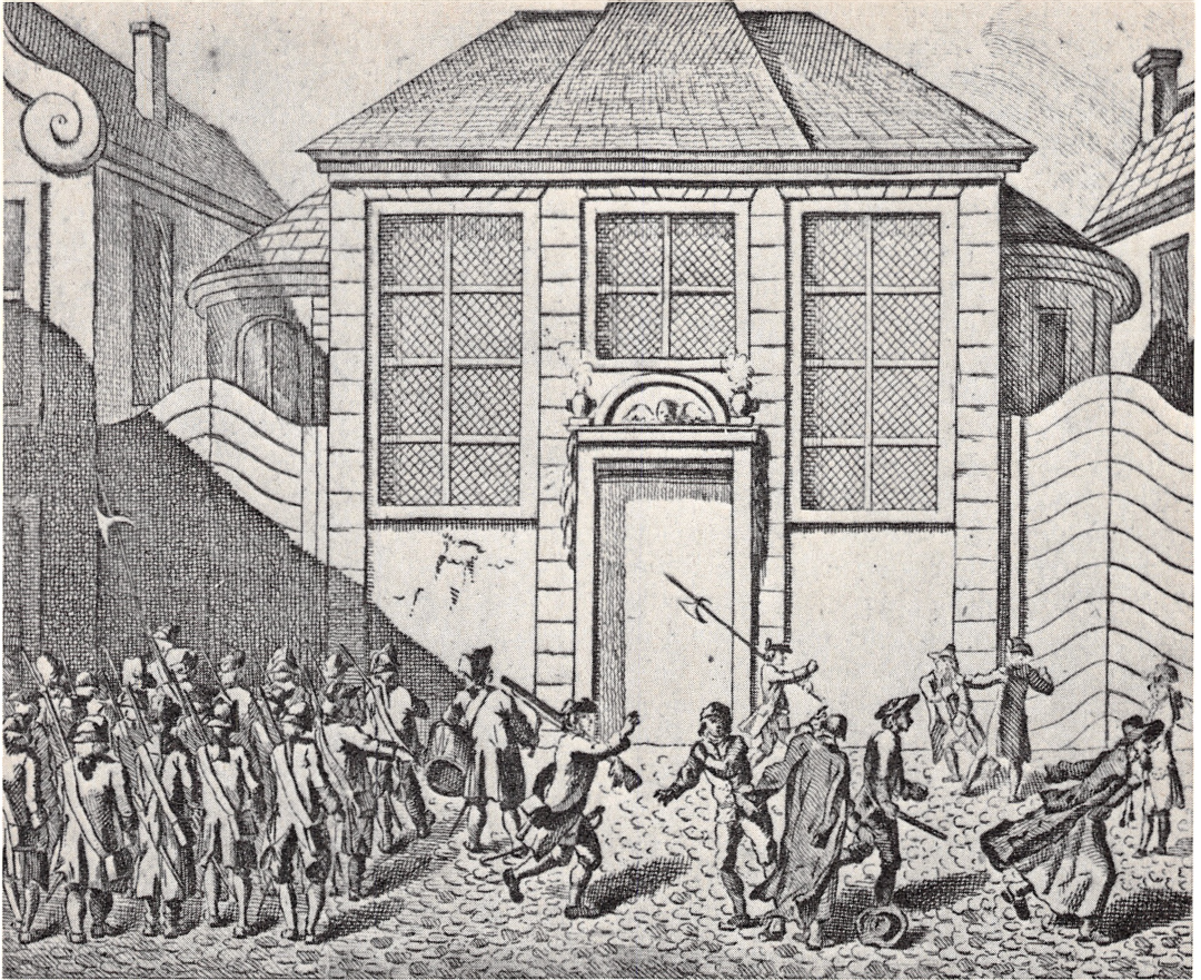
Den tysk-danske kunstner Haas har i 1774 stukket dette billede af en uro i København. Nogle jøder, i lange gevandter, synes at blive angrebet af nogle borgere. En gruppe militærfolk er ved at gribe ind. Proveniensen: Det kongelige Bibliotek.

zum siebzigsten Geburtstage 15. Juli 1916 (Berlin 1917).