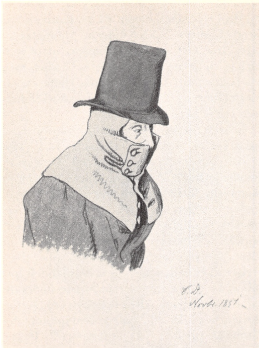
Anno 1851: Den jyske bonde gruer ved tanken om, hvordan det gik den gode, men gale greve. (Tegning af C. Dahls-gaard).

tende protestbølge mod hoveriet frem til Middelsom herred. Bønderne strejkede på Skjern, og næste år var der uro på Ulstrup, Randrup og Skaungård. På samme tid begyndte bønderne at ansøge herskaberne om at få fællesskabet opløst. Der var altså i det mindste tale om et tidsmæssigt sammenfald mellem hoveribevægelsen og de mere eller mindre klart artikulerede krav om udskiftning. Om bønderne har opfattet de to problemer som dele af en større sammenhæng, siger kilderne ikke noget konkret om.