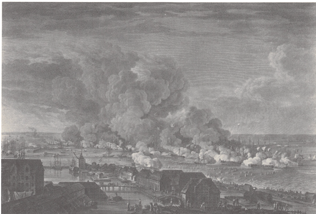
Fig. 1. For kronprins Frederik udførte C. A. Lorentzen (1749–1828) to malerier af slaget på Reden. Det kendteste af de to påbegyndte han umiddelbart efter slaget, på grundlag af en skitse tegnet fra Vor Frelsers Kirkes tårn på Christianshavn. Arbejdet var færdigt inden årets udgang, og straks efter gik hofkobberstikker J. F. Clemens (1748–1831) i gang med det stik af maleriet, som skulle komme til at indtage hæderspladsen i empiretidens danske borgerhjem. Under sit arbejde havde Lorentzen fået hjælp af de søofficerer, der havde kæmpet den anden april; og da Clemens i årene fra 1802 til 1805 arbejdede på sit stik, der teknisk kunne bringe detaljer, som et maleri umuligt kunne gengive, var de samme søofficerer hans hjælpere og kritikere. Stikket er derfor en fremragende kilde til situationen under kampens mest intense fase omkring klokken tolv, hvor alt endnu var kanondrøn og bombebrag. Kampen havde da været henved halvanden time; Olfert Fischers slagskib Dannebrog stod i flammer, fregatten Elven stod ind mod Inderreden, og kavalleriprammen Nyborg var på vej ind over Refshalegrunden med den synkefærdige Aggershus på slæbetov. Men også de engelske skibe bærer præg af kampen, hvis udfald endnu ikke er afgjort.