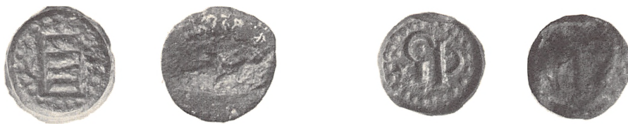
Fig. 3-4. For- og Bagside af stempelstykker fra Erik Menved, Lund, Hauberg nr. 9, Mansfeld-Büllner 302 samt Magnus Eriksson Smek, Lund, Hauberg 1, Mansfeld-Büllner 638. Motiverne er henholdsvis Sankt Laurentius' rist og et »R« omgivet af halvmåne og stjerne. Kulturen, Lund inv. KM 22.826.

blot fire stempel-»hoveder«, alle fra Lund 7 . Årsagen til, at det kun var den øverste del af over- eller understemplet, der var fundet, kan være, at denne var af særlig hårdet stål, som blev opbevaret for sig og i øvrigt havde en kortere levetid end selve stempel »kroppen«. Tykkelsen varierer fra en halv til godt tre cm. Efter at møntmotivet var islået med små specialstempler, punse, eller indgraveret, er det lille stempelstykke blevet fastgjort til selve stempelkroppen – man kan se spor af de tapeller studshuller, som har været benyttet ved fæstelsen (fig. 4). Det ældste af disse stempler er fra Christopher I.s tid (1252–59), mens det yngste er omkring hundrede år yngre. To af stemplerne var fundet nær møntsmedjens gamle område syd for Domkirken. I 1975 fandt man så i Lund det første hele stempel, et overstempel fra Erik Plovpenning's tid (1241–50) (fig. 2). En røntgenundersøgelse viste også en tydelig skillelinje mellem stemplets to dele 8 . At forholdet har været det samme i England i vikingetiden tyder et af de