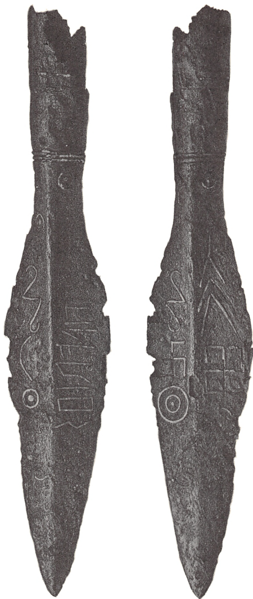
Fig. 1. Kowel † lansespids. Fotografvure i Rudolf Hennings Deutsche Runendenkmäler. Strassburg 1880, Tafel I, sign. Nach Lithogr. von K. I. Becker – Verlag von Karl J. Trübner. Strassburg – Photogravure H. Riffarth. Berlin. Dette fotolithografi er af primær kildeværdi, især i forbindelse med Rud. Hennings meget grundige beskrivelse af de enkelte runer og deres tilstand. Rune 3 fra venstre (1) var beskadiget (og det er måske derfor, sølvindlægningen mangler foroven i hovedstaven); på den anden side kunne den måde, bistavens sølvtauschering løber ud (i en spids) måske tyde på, at »sølvbistaven« aldrig har været længere(?).

Den følgende rune, L, fortsætter Henning, er ikke ganske lukket foroven og er noget beskadiget . Bemærkelsesværdig er, at den er mindre end den følgende. Bemærkelsesværdig er, at den er mindre end den følgende. Bemærkelsesværdig er, at den er mindre end den følgende. Bemærkelsesværdig er, at den er mindre end den følgende.