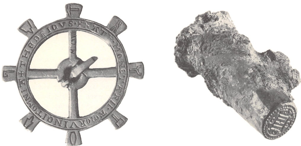
Fig. 1. Det vistnok eneste danske billede af møntprægningsværktøj er dette spænde, der indkom til Nationalmuseet 1823 som jordfund fra Bornholm. Dets latinske indskrift betyder »Didrik, møntmesterens broder«, og fundstedet antyder, at møntmesteren var fra Lund. Øverst ses en glødehage som brugtes til at trække digler med smeltet metal ud fra ilden. Til venstre her for følger understempel med spids til at fastgøre i træblok, overstempel til at holde på samt hammer til prægningen. Datering: formentlig 1200-tallet. Diameter: 55 mm. Inventarnummer: Nationalmuseet 2. afdeling MLXVIII a.