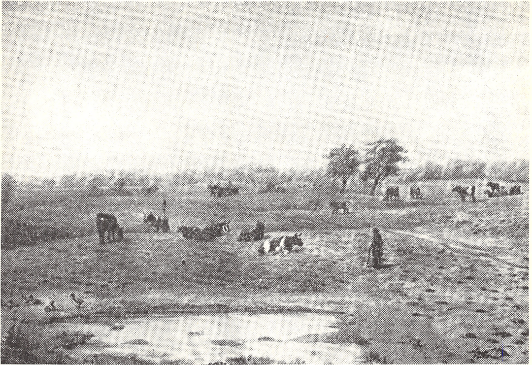
Fig. 4. A. P. Madsens akvarel af et typisk overdrev (Vindstrup Overdrev i Sydøstsjælland). Med udskiftningen og udflytningen omkring 1800 forsvandt overdrevene og hovedparten af de oldtidsminder, som lå der.

overdrevet ændres nu til en intensiv, samtidig med at der sker en udflytning fra landsbyerne (fig. 4). Udskiftningen gennemførtes hovedsagelig i løbet af 1970'erne; den foregik tidligst i Sønderjylland, noget senere på øerne, men specielt sent i Nørrejylland, hvor kun halvdelen af jorderne var udskiftet i 1807. Selve udflytningen fra landsbyerne foregik i et væsentligt langsommere tempo.