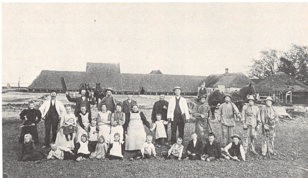
Billedet viser Loftbro Teglværk ved Nørresundby o. 1904. Teglværket er oprettet o. 1840 og overtaget af Rørdal Cementfabrik o. 1918. Teglværket fremstillede tagsten og håndstrøgne mursten. De fire tilsøede personer til højre i billedet med teglstensforme og andet værktøj er svenske »børster«. Den runde bygning til højre i billedet er ælleværket, der blev drevet af en hestegang.

hverdag og specielt i fest. Ligeledes behandler forfatterne arbejdskampene omkring organisationsretten og kampen for løn- og arbejdsforhold og derunder truslen fra mekaniseringen.