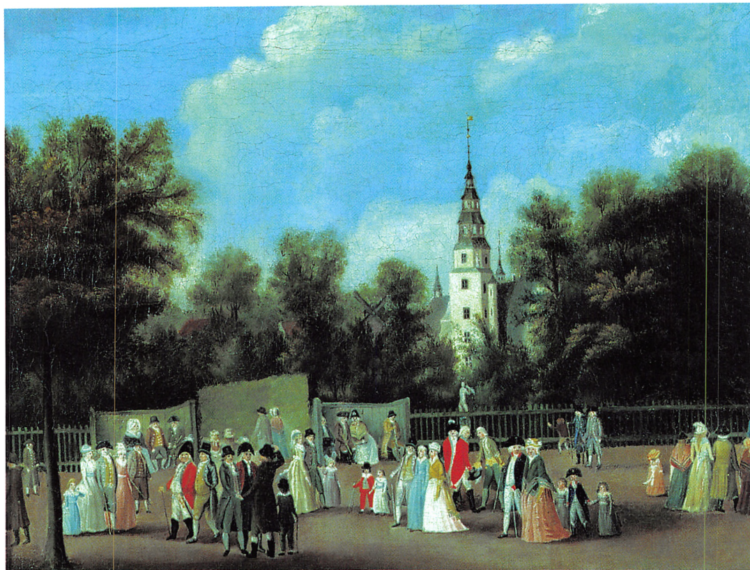
Kongens Have blev anlagt som lysthave omkring Rosenborg slot i København. I årene 1606-1607 erhvervede Christian 4. en række grunde og havelodder uden for Østerport til formålet. Under Frederik 4. åbnedes Kongens Have for honnorte folk og i 1771 dekreterede Struensee haven åben for alle til »Publici fornøyelse«. Haven blev herefter Københavns foretrukne promenadeplads. På billedet ses Rosenborg slot malet i 1780 set fra Parterrehaven. Maleren har stået helt oppe ved rækværket ud mod voldgraven. Billedet er malet i den periode, hvor slottet var kalket gråhvidt. Således så det ud i omkring 100 år.