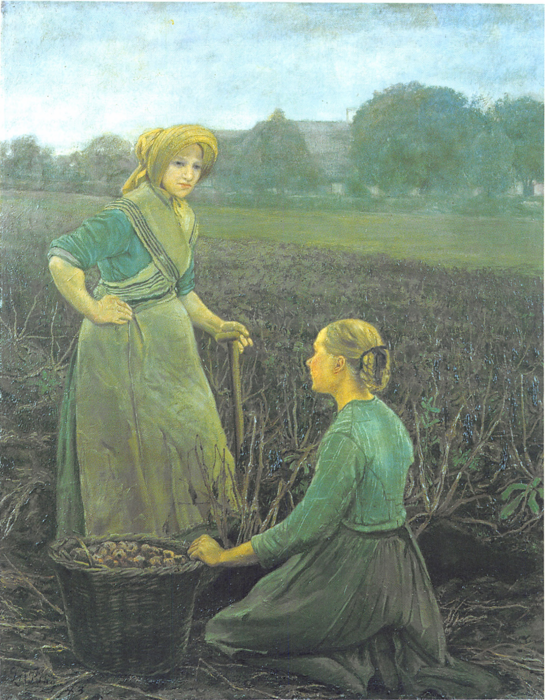
Det tog lang tid for kartofflen at blive dansk nationalklenodium. I mange år brugtes den udelukkende til kreaturfoder, men i løbet af 1800-tallet begyndte den at blive anvendt som menneskeføde. Det skyldtes uden tvivl at ældre tiders søbemad og »brøddisk« i løbet af 1800-tallet gradvis blev udskiftet med mad, kogt på komfur og serveret på tallerken. Maleri af L.A. Ring fra 1883 (Den Hirschsprungske Samling).