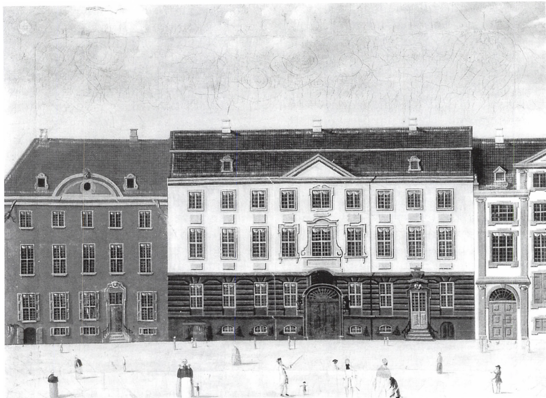
I 1728 lagde en voldsom ildebrand Elephantapoteket i Købmagergade helt i aske. Familien Becker, der havde ejet og drevet apoteket siden 1670 påbegyndte i 1733 en genopbygning af apotekergården med hofbygmester Laurids de Thurah som arkitekt. Det tog fire år at færdiggøre den nye apotekergård, der blev genopført i den form, som dette billede af Rach og Egeberg viser. I den mellemliggende periode havde familien Becker lejet sig ind i en gård på Amagertorv, hvorfra apoteket midlertidigt blev drevet. Da apoteket atter åbnede i Købmagergade var det med egen indgang til højre under bomærket med den hvide elefant.