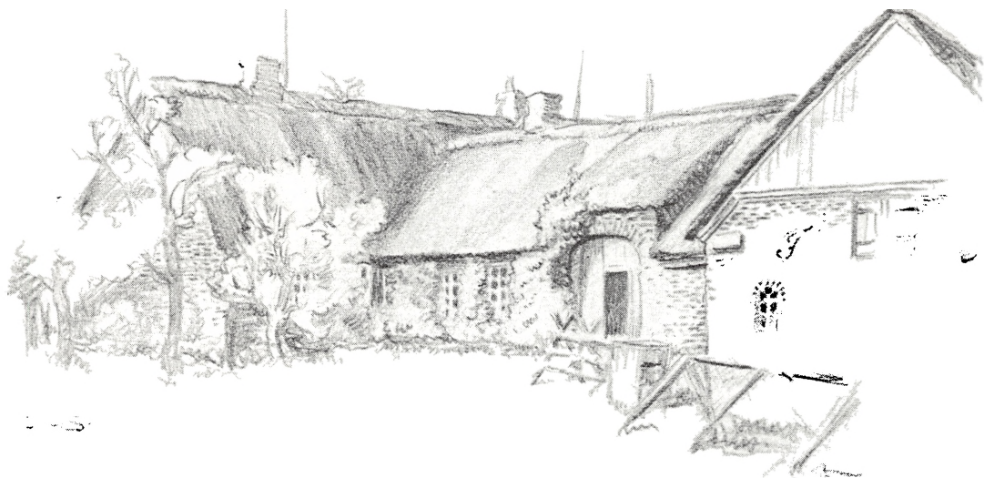
Truels Stauning Jensens gård i Rejsby tegnet af Gerda Ploug Sarp 1928.