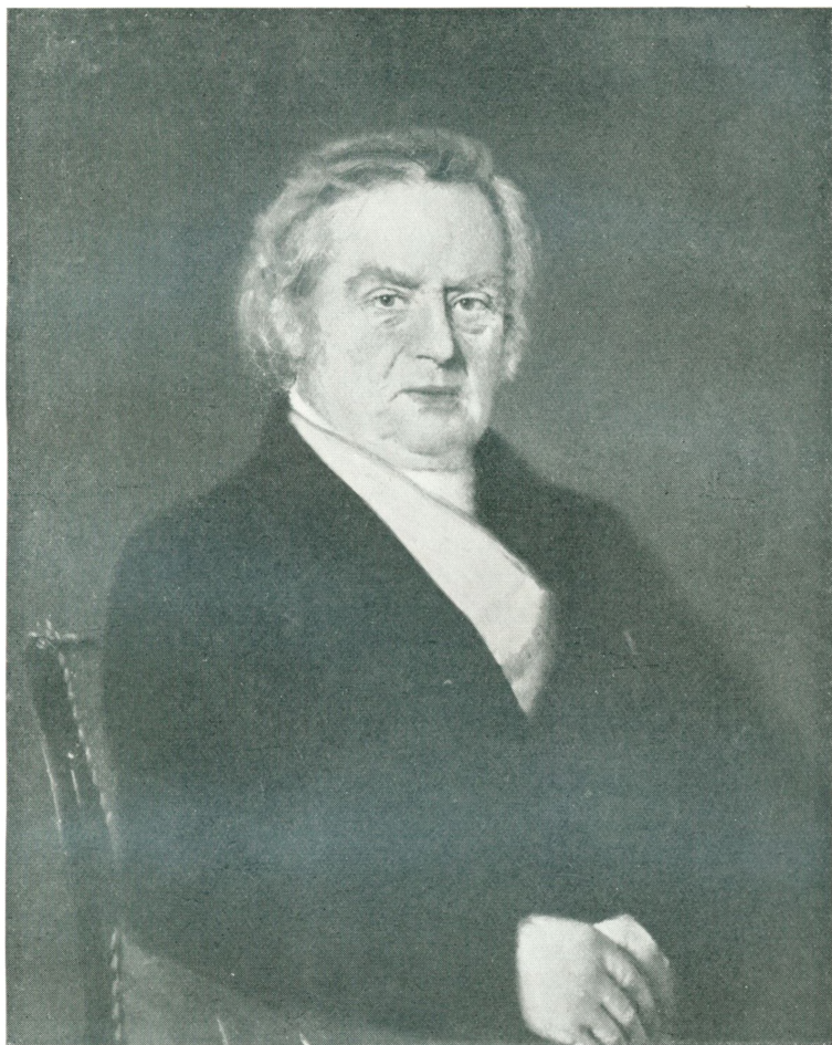
ANDERS SANDØ ØRSTED Fotografi efter C. A. Jensens Maleri (c. 1840).