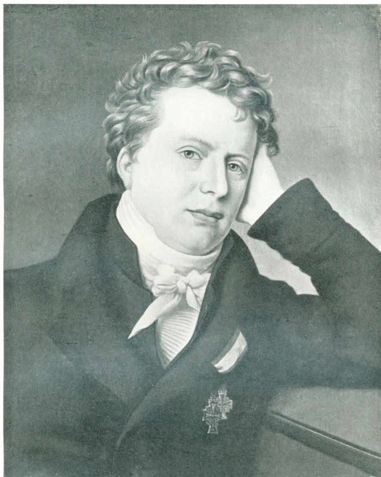
ANDERS SANDØE ØRSTED Fotografi efter C. W. Eckersbergs Maleri (1821). (Statens Museum for Kunst.)