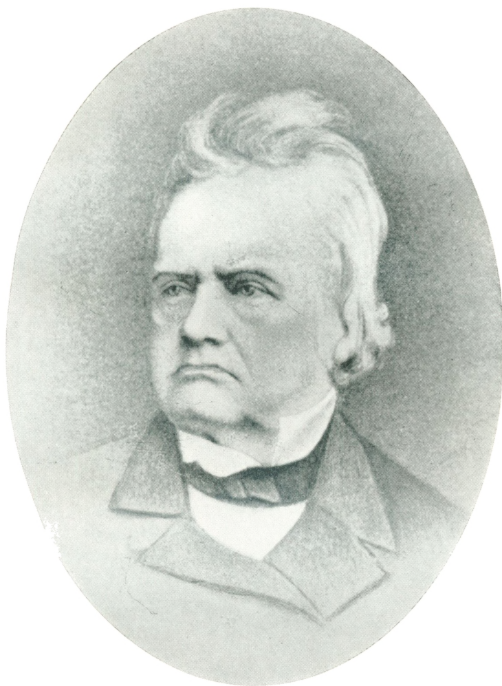
ANDERS SANDØE ØRSTED Fotografi efter Daguerreotypi (c. 1849).