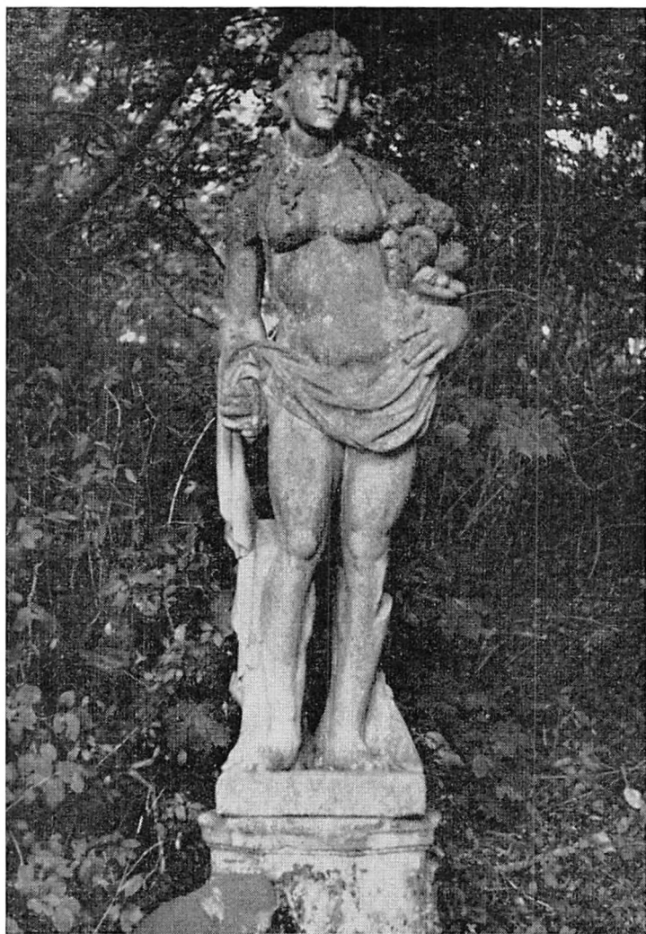
Grevinden med ni-lingerne.