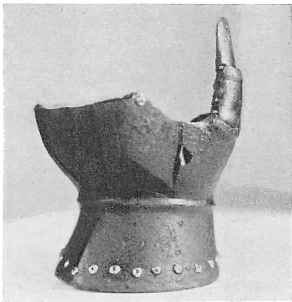
Panserhandske fra Ørum.

konserverede den og reparerede Tommelfingeren. Efter Meddelelse fra Nationalmuseet er det en stor Sjældenhed. I Danmark er ikke tidligere fundet noget lignende; ude i Europa findes forskellige tilsvarende Stykker, men kun faa.