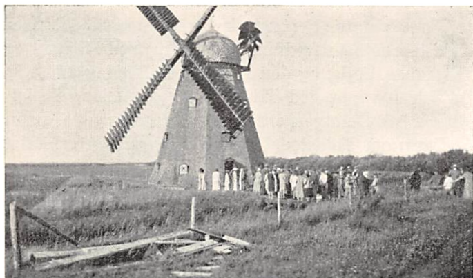
Møllen ved Bygholms Vejle.