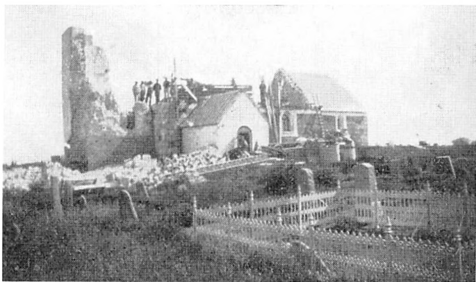
Arup Kirke under Ombygning.

Den Revne, som blev slaaet i Kirketaarnets vestre Væg, var endnu tydeligt at se, da Taarnet for godt