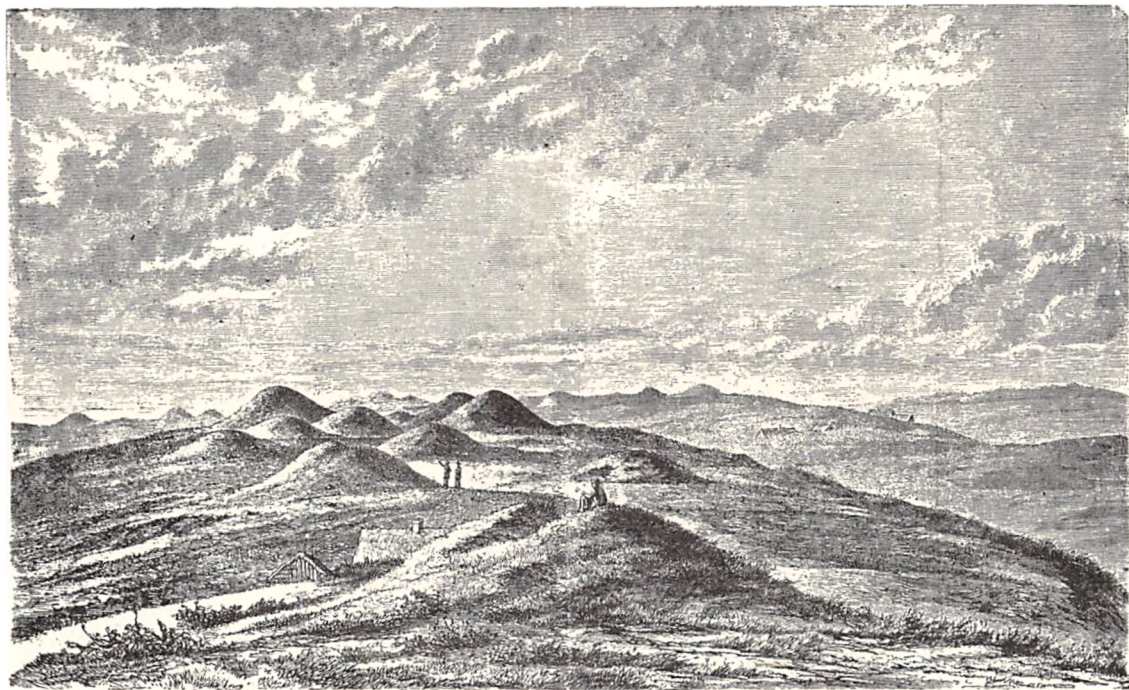
St. Jørgensbjerg. (Efter en gammel Tegning af Magnus Petersen).