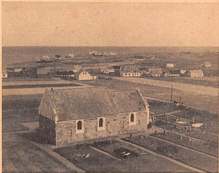
Parti af Hansted By og Kirke før 1940