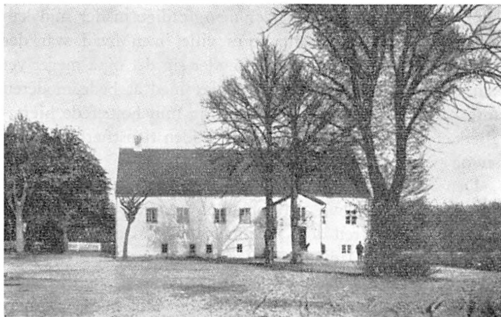
Harrested, set fra vest