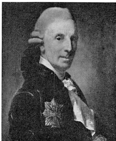
Frederik Vilhelm Wedel Jarlsberg

I Wedel Jarlsbergs Skrift forekommer bl. a. følgende Paa-stand: „Vor lovlige Hoveri-indretning er uimodsigelig den