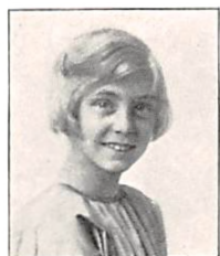
147 I. PERMIN