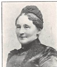
208 J. E. C. PERMIN f. MØLLER