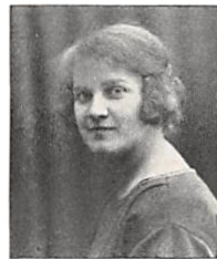
111 E. PERMIN