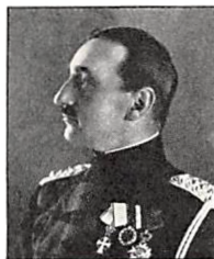
116 O. H. PERMIN