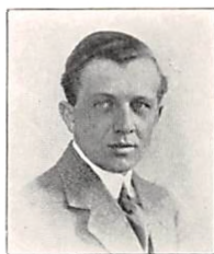
268 J. PERMIN