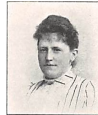
218 F. E. M. PERMIN f. SCHILDER