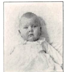
270 A. PERMIN