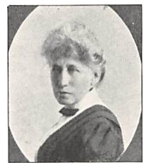
211 C. PERMIN