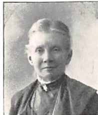
141 O. P. E. PERMIN f. HOLM