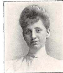
284 E. I. PERMIN