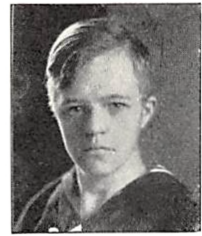
276 H. PERMIN