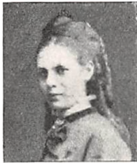
296 O. C. KELLER f. GRØNVOLD