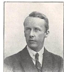
112 H. PERMIN