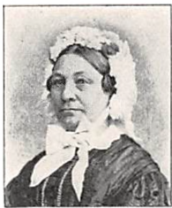
157 C. M. SCHOUSBOE f. PERMIN