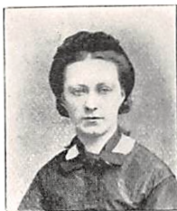
163 J. C. L. JUEL f. SCHOUSBOE