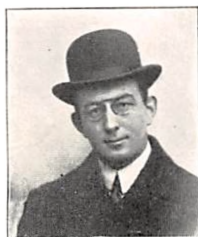
136 A. CHR. H. PERMIN