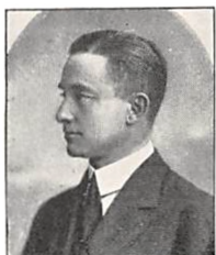
148 C. H. PERMIN