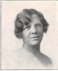
273 G. PERMIN