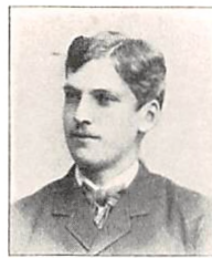
298 C. CHR. GRØNVOLD