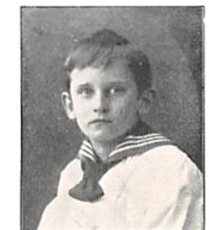
225 W. PERMIN