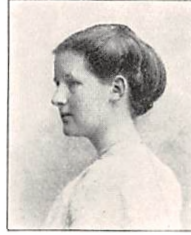
279 K. M. GJESSING