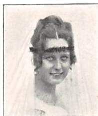
145 C. S. B. PERMIN f. SCIOU