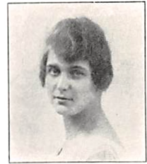
266 H. M. PERMIN f. ANDERSEN