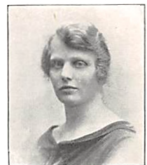
108 E. PERMIN f. GERLACH