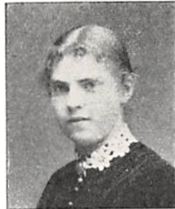
297 E. M. J. GRØNVOLD