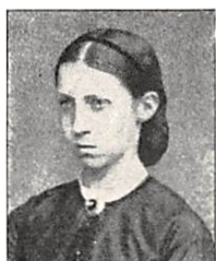
242 J. S. SEWERIN