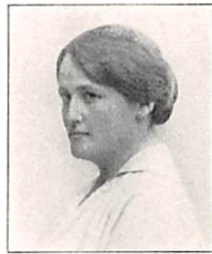
286 J. PERMIN f. DYRLUND