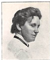
226 D. E. REISZ f. PERMIN