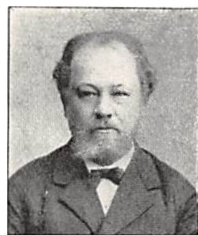
125 P. S. PERMIN