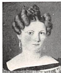
121 Ungdomsbillede malet af Kuehler. Fjes af Frk. Else M. Permin