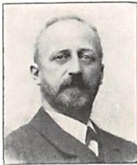
97 C. II. J. PERMIN