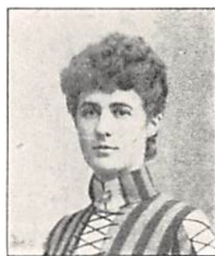
66 A. F. E. PERMIN