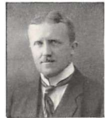
103 E. II. PERMIN