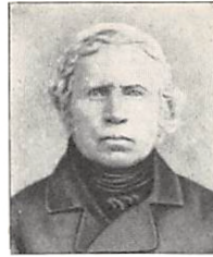
174 H. K. BAASTRUP