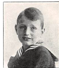
292 N. E. PERMIN