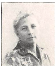
308 D. GEISMAR f. PERMIN