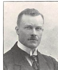
107 A. PERMIN