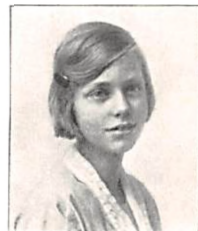
146 J. PERMIN