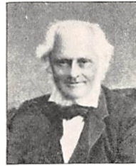
295 G. A. GRØNVOLD