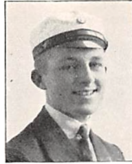
151 H. HOFFMEYER