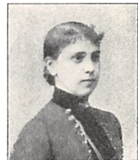
299 E. GRØNVOLD