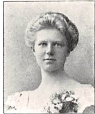
282 J. PERMIN f. FJORD