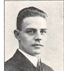
312 J. C. I. GEISMAR