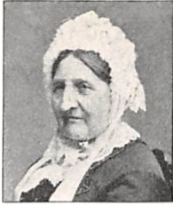
203 C. M. PERMIN f. BENDTSEN