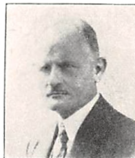
309 F. B. GEISMAR