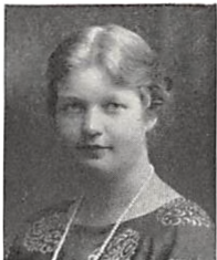
104 A. E. PERMIN f. CHRISTENSEN