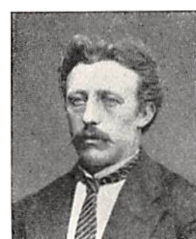
245 JOIS. E. SEWERIN