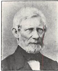
95 O. II. PERMIN