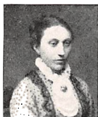
246 M. C. KÜHNEL f. SEWERIN