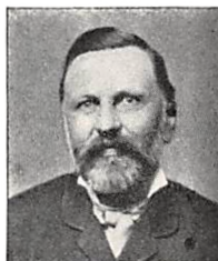
123 E. GUNDESTRUP