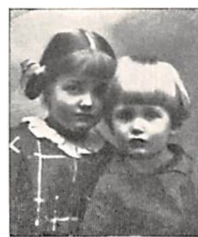
138 og 139 E. M. PERMIN og J. CHR. FR. PERMIN