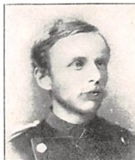
100 J. H. A. PERMIN