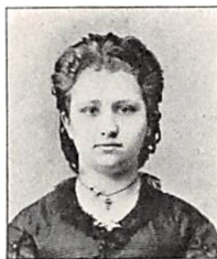
122 H. H. M. GUNDESTRUP f. PERMIN