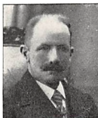
234 E. PERMIN