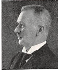
278 G. GJESSING