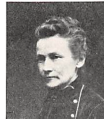
302 E. K. M. PERMIN f. BRUN