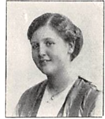
280 A. GJESSING