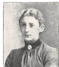
70 I. A. L. C. GULDAGER f. PERMIN