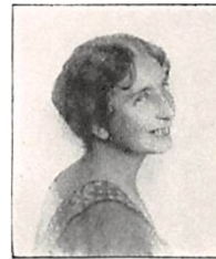
290 E. PERMIN f. SCHLICHTKRULL