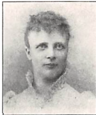
98 C. A. PERMIN f. MÜLLERTZ