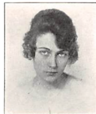
269 G. K. F. PERMIN f. WITTUS