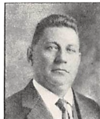
306 H. PERMIN