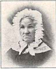
90 G. M. PERMIN f. OLSEN