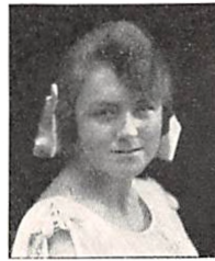
154 E. A. HOFFMEYER