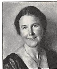
117 N. PERMIN f. AÆSTRUP