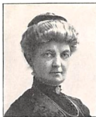
128 J. P. B. PERMIN f. HOFFMANN