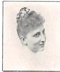
255 A. M. II. NYEBORG f. PERMIN