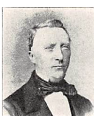
244 E. D. J. SEWERIN