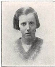
287 E. L. PERMIN