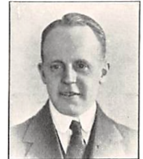
219 W. PERMIN