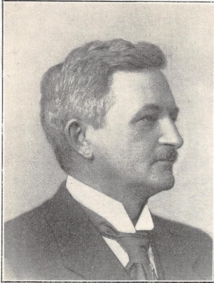
Dr. C. G. Joh. Petersen, forhv. Leder af Biologisk Station.

gør alt, hvad muligt er for at udbrede Østers til nye Banker ved Hjælp af Sværmyngel, der driver mange Mile med Strømmen, og at Østersen altsaa som Regel findes overalt, hvor den kan leve.