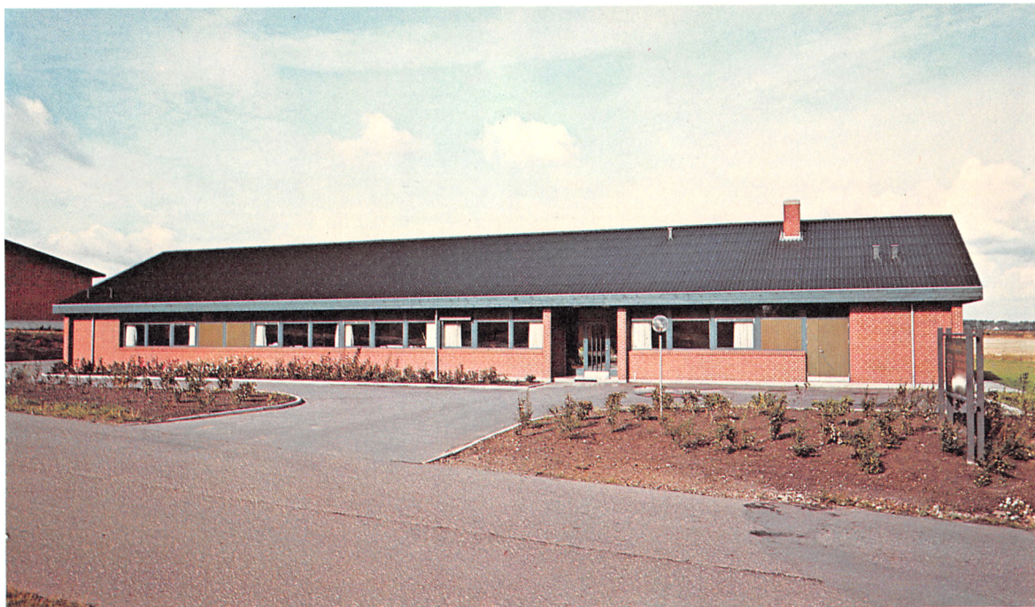
Den nye trykkeribygning, Ærøvej 8