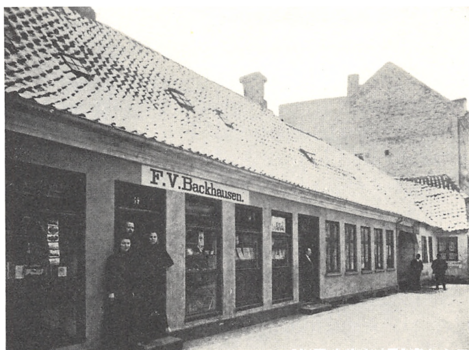
Mathiasgade 34, Viborg