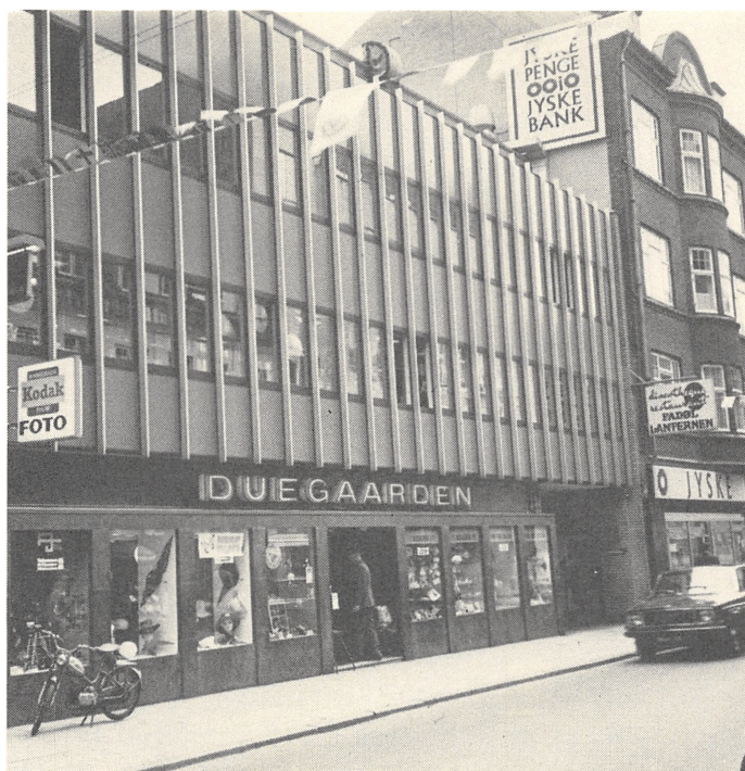
Duegaarden, Sct. Mathiasgade 34