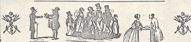
Bærtsh. om Bærtsh. om Du Bærtsh. Bærtsh. sig vil sig veger Bærtsh. om gæmst vore bærtsh. Bærtsh. her, da her Bærtsh.

Wer nicht liebt Wein, Weib und Gesang, Der bleibt ein Narr sein Leben lang.