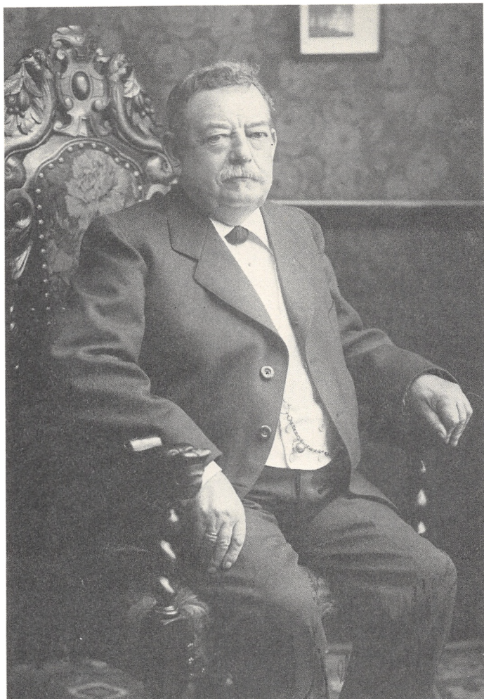
Frederik Vilhelm Backhausen