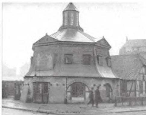
Røde Mølle efter ombygningen til forlystelsessted.

var større end de gamle stubmøllers, så der var plads til langt mere maskineri med kværne, valsestole og sigter. Til forskel fra stubmøllen, hvor hele møllehuset drejede, og som derfor kun kunne bygges i mindre størrelse og i et let materiale som træ, behøver man kun at dreje toppen på en hollænder, og man kunne derfor bygge både større og mere solide møller.