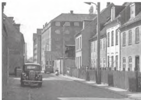
Husene i Øselsgade.

Men før hun kan vende hjem, fortsætter dagen - et par gange om ugen - med endnu nogle timers aftenarbejde, så det bliver sent inden den 10-årige Anna finder hjem i mørket. En