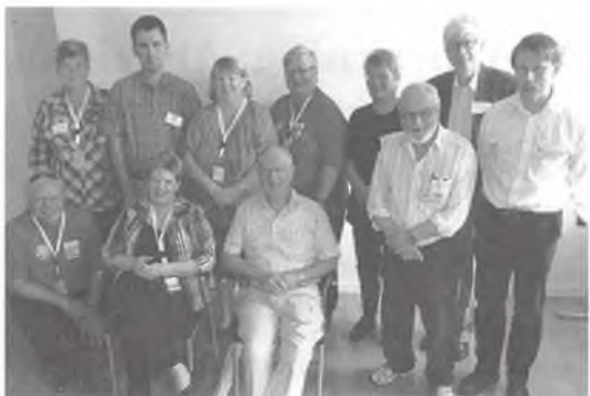
Foto af de deltagende nordiske medlemmer.