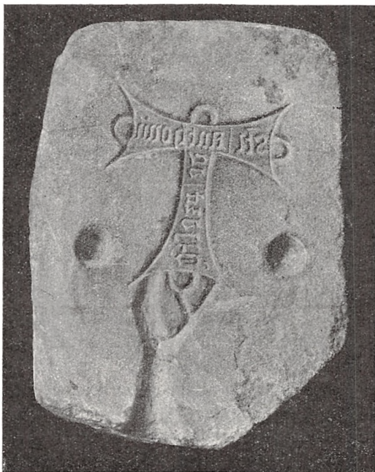
Fig. 1. Støbeform til Pilgrimstegn fra Præstø Kloster.

Af andre kirkelige Genstande fra Middelalderen har Museet bl. a. modtaget en romansk Vinduesoverligger fra en jydsk