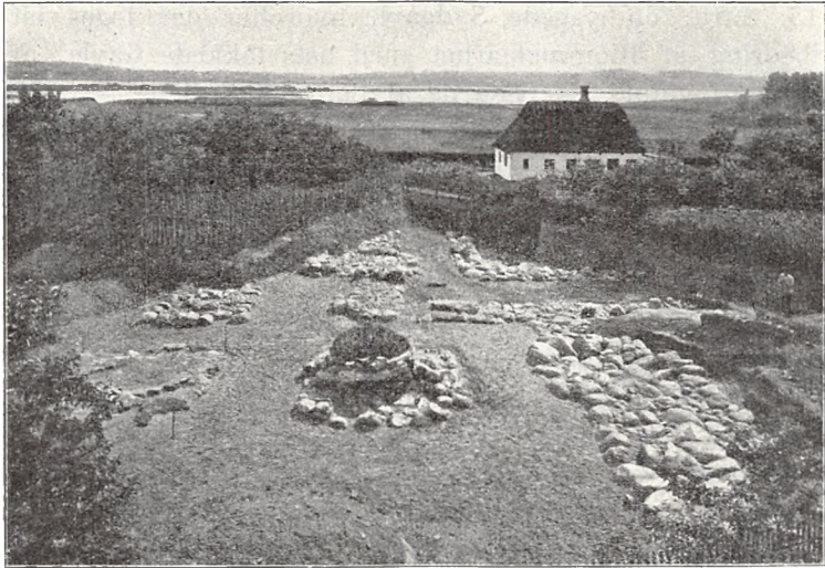
Fig. 3. Om Klosters Kirketomt.

Gaardtomten Boringholm ved Horsens er nu endelig afsluttede, idet næsten hele Gaardens Terræn er gennemgravet. Resultaterne af de sidste Aars Arbejder har stadfæstet og uddybet de lagttagelser, der gjordes ved Udgravningens Begyndelse. Selvom de skrevne Kilder kan efterlade nogen Tvivl, tyder alt dog paa, at Dronning Margrete har nedlagt denne Adelsborg, der næppe engang har eksisteret i hundrede Aar. Alt, hvad der er fundet paa Tomten, synes nemlig at stamme fra 1300'erne, og