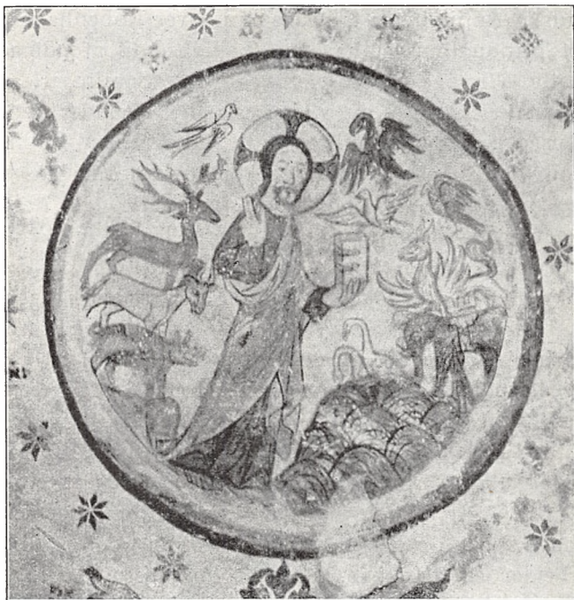
Fig. 5. Kalkmaleri i Broby Kirke.