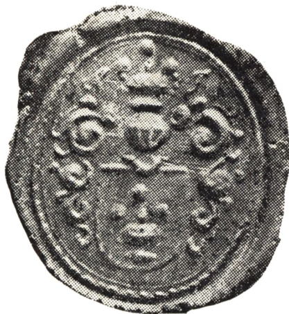
Thura'ernes første Vaaben (det borgerlige).