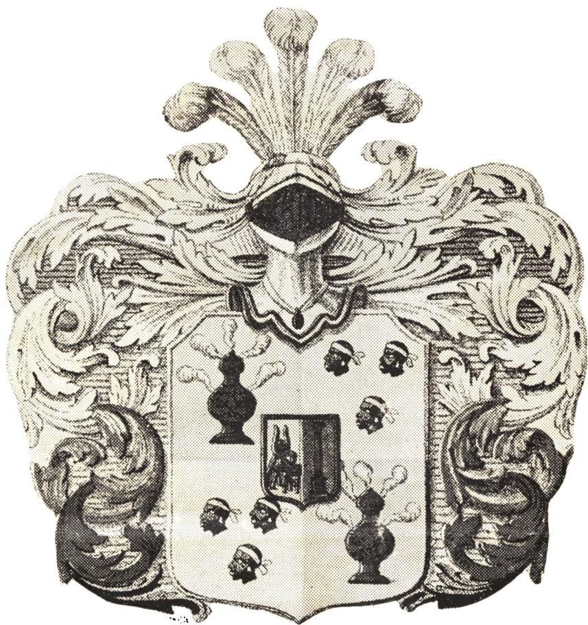
de Thurah'ernes Vaaben.