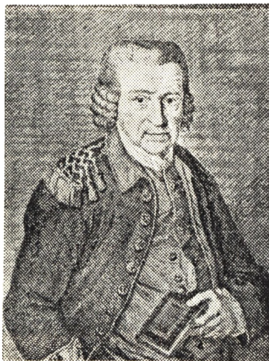
Diderik de Thurah,

S LÆGTEN DE THURAH kan den 14. Oktober fejre en særlig Minde- dag, eftersom der da er forløbet 200 Aar, siden Slægten blev optaget i Adeis- standen, hvilket paa den Tid var en stor Begivenhed. Thuraherne kan følge deres Ahner ligesaa langt tilbage som den danske Historie rækker, nemlig til Gorm den Gamle. Men den første i Slægten, der bar Navnet Thura, var Provsten i Nykøbing paa Falster.