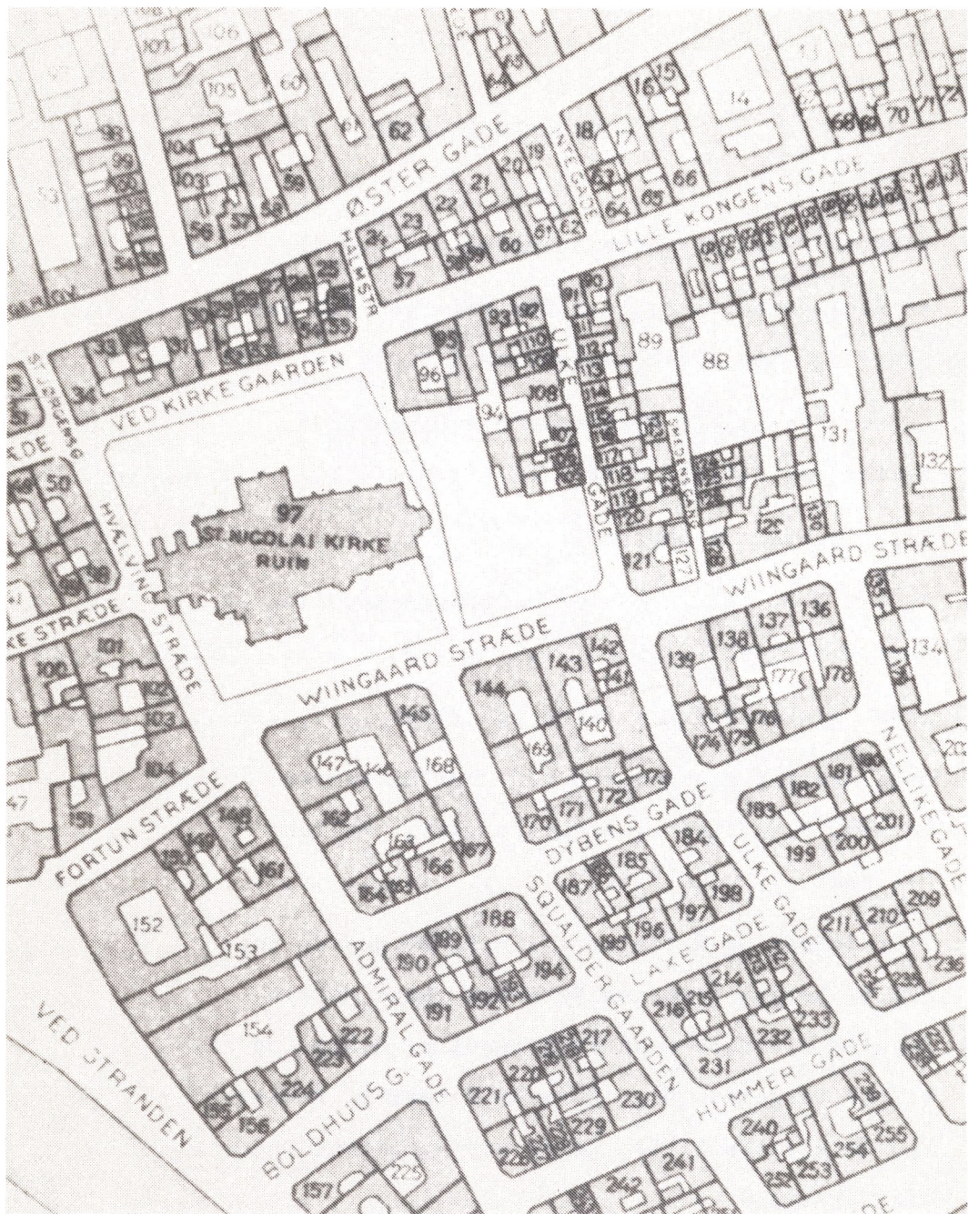
Brudstykke af Kort over København fra 1807 tilhørende Københavns Stadsarkiv.