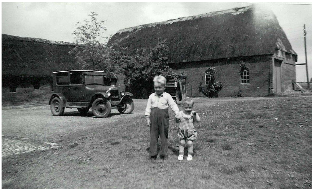
Gårdspladsen før moderniseringen med den gamle Ford – i forgrunden min fætter og lillebror

For at være med i den almindelige udvikling, blev en brugt traktor anskaffet, et stort skrummel på jernhjul, der dog senere blev erstattet med gummihjul. Endvidere blev personbilen, en gammel Ford, midt i halvtredserne udskiftet med en lille lastbil, der først og fremmest blev brugt til gårdens drift, såsom indkørsel af korn, roer og kartofler, men også til personkørsel.