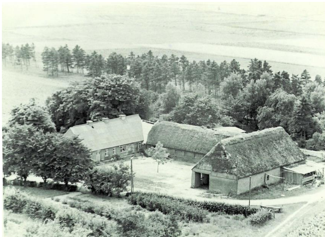
Meldgaard o. 1950

"Meldgaard" lå i Nybo ca. 5 km nord for Herning midt imellem Herning-Viborg-landevejen og Herning-Viborg-jernbanen. Den var udstykket fra Neder Vraa o. 1890 og havde i 1946 et hartkorn på 1 tønne, 1 skp., 2 fdk. og \frac{1}{2} album med matrikelnumrene 1d, 1k, 1o og 3g, arealet var på godt 30 tdr. land.