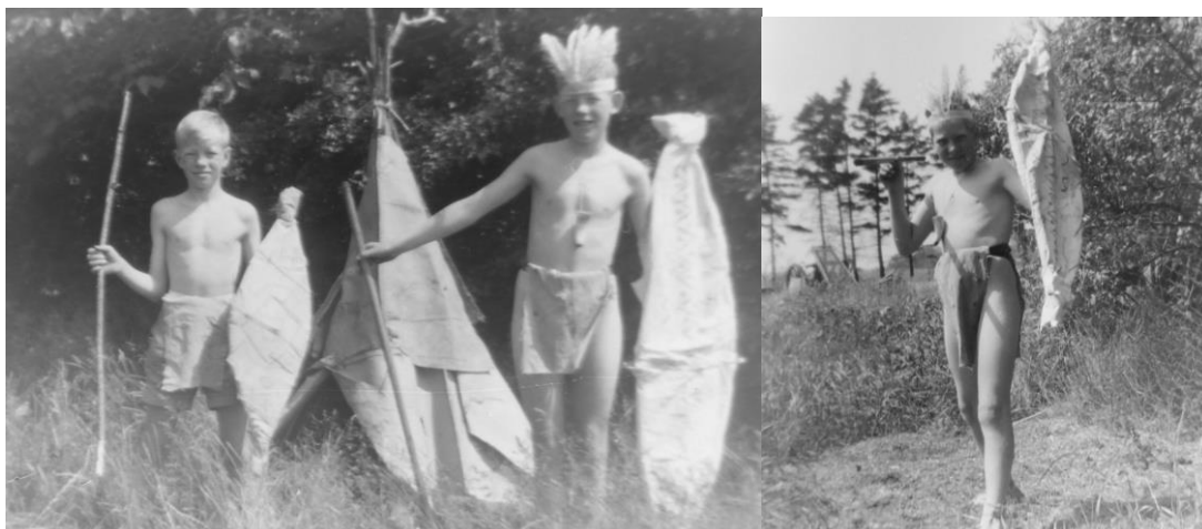
Min fætter, min bror og mig

Da far og mor overtog gården, var taget endnu stråtagt, og trækraften til landbrugsredskaberne bestod af 2 heste. Den øvrige besætning var efter nutidens målestok ret beskeden, men svarede vel nogenlunde til det normale på den tid: ca. 10 køer, nogle kvier og kalve, et par søer og hvad de kunne give af fedesvin. Gården var forsynet med el, indlagt vand og malkemaskine; og både ajlepumpe og kværn blev trukket ved hjælp af elmotor.