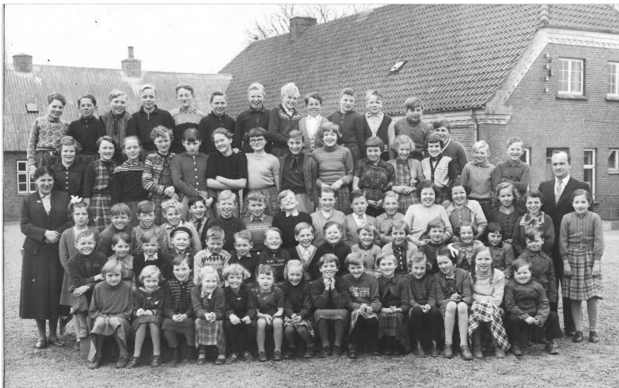
Lund skoles elever – skoleåret 1955-56

Endelig havde skolen engang besøg af en omrejsende ”dyreopvisning”, dvs. en lastvogn med 8-10 bure på ladet, hvor der opholdt sig nogle eksotiske dyr, som fx aber o.l. Dyrene har sikkert haft det forfærdeligt på den trange plads, men vi betragtede dem selvfølgelig med stor interesse.