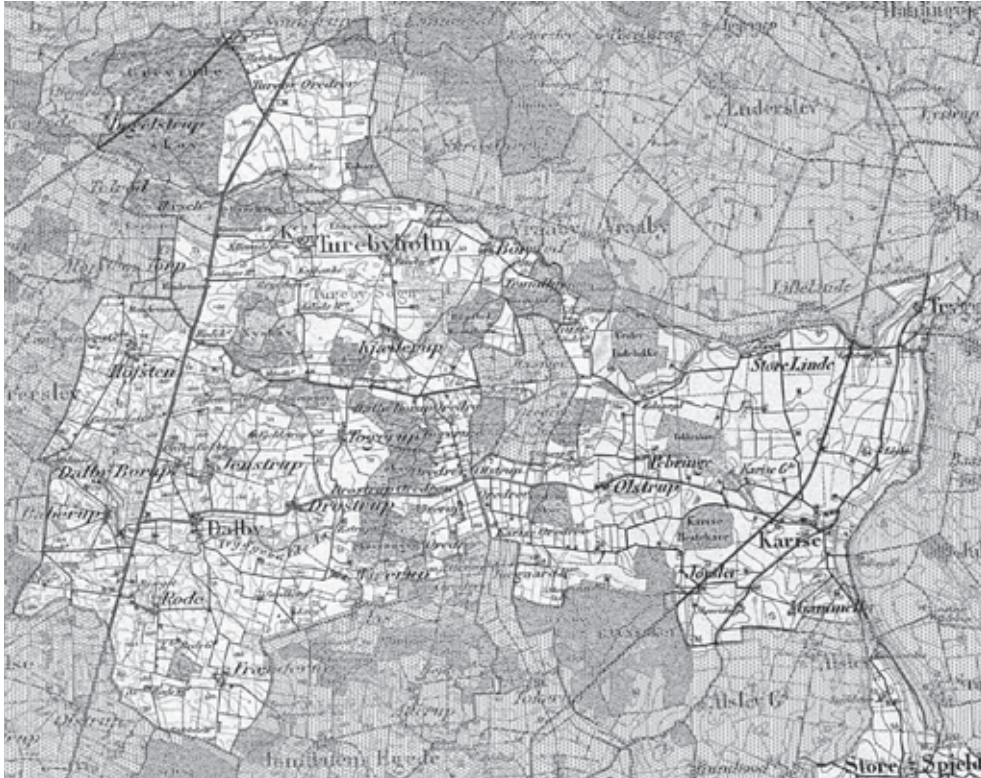
Figur 1. Kort over Turebyholm med sognene Tureby, Karise, Dalby og lidt af Spjelderup, hvor fæsteforholdene undersøges i denne artikel. Turebyholm indgik i Bregentveds enorme godskompleks, der også omfattede hovedgårdene Tryggevælde og Juellinge. Atlasblad Store Heddinge 1:80.000, målt 1847.