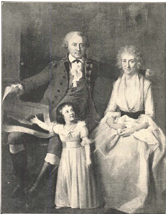
Norsk Statsminister PEDER ANKER med Hustru ANNA ELISABETH , født COLD og Datter, den senere Grevinde KAREN WEDEL-JARLSBERG (Malet af Jens Juel 1792).