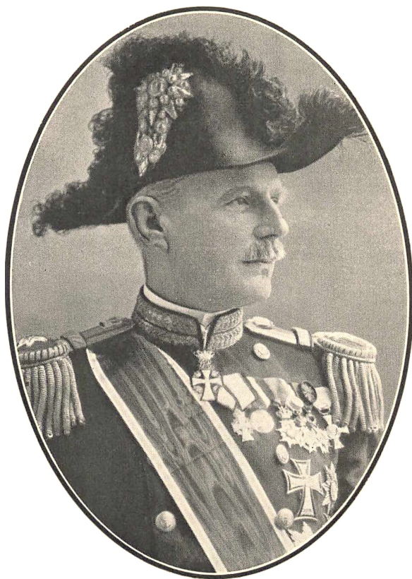
Kontreadmiral F. COLD