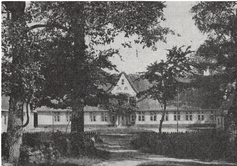
Felsted præstegård. Fot. ca. 1880.