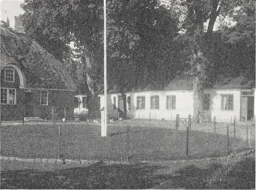
Vonsild præstegård, fot. ca. 1890. Den røde bygning til venstre, der nu rummer konfirmandstuen, var i Mørk Hansens sidste år bolig for en kapellan.

Sogn, og fik af mig i Pension omtrent 8 Kr. daglig. Vi bleve let enige om Alt, kun vilde han have Pengene for Bygningen kontant udbetalt med omtrent 8 000 Kr. Jeg havde haabet, at min store Eftergivenhed imod ham skulde have bevæget ham til at give mig Henstand, idet jeg jo havde lidt et stort Tab derved, at han ulovligt havde solgt hele det foregaaende Aars Afgrøde bort fra Markerne, saa at der ingen Gødning var. Ligeledes havde han forsømt at nedlægge Udsæd af Kløver og Græs i Havren.