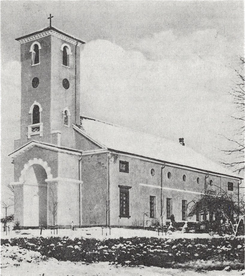
Vonsild kirke, fotograferet inden ombygningen af tårnet.

Sabel haardt imod Gulvet og sagde, at Preussens Fremfærd havde været lumpen fra først til sidst. Endelig tog han mig i Haanden og ønskede mig Guds Velsignelse til min Gjerning i Vonsild.