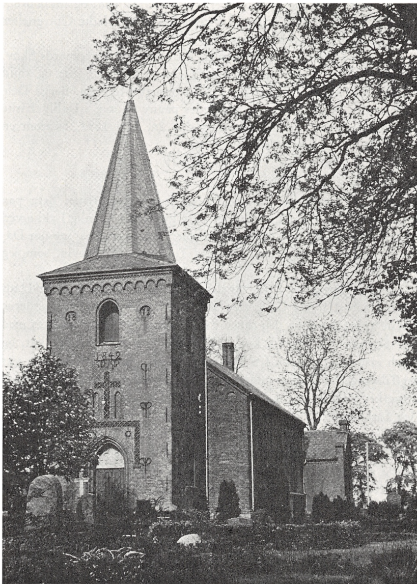
Dalby Kirke. Fot. Esben L. Esbensen 1967.

og især for Degn Kloster, der mente at have nogen Skyld, da han havde forsømt at tage Altertøjet med sig hjem. Jeg trøstede ham dog med, at en taabelig Lov bestemmer, at Kirkens Kar netop skulde