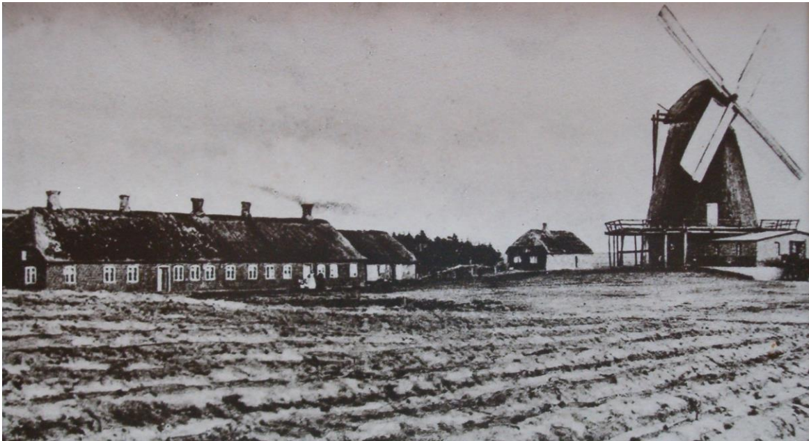
Møllegården og møllen i begyndelsen af 1900-tallet