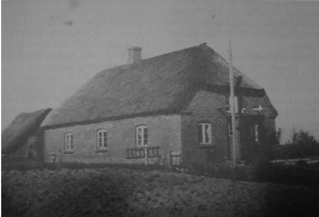
Kommunens hus 1937