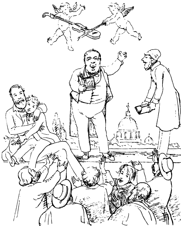
Karikaturtegning af Rud. Bay og hans Følgesvend, applauderet af danske Kunstnere i Rom. Pennetegning af Const. Hansen.