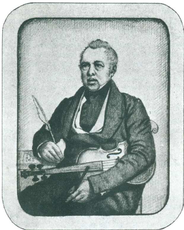
RUD. BAY Efter Daguerretypl, taget i Paris 1843.