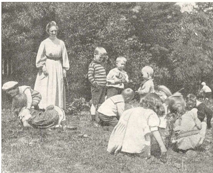
Børnehaven i Hellerup. Paa Legepladsen.

forsvarlig Uddannelse; men det var selvfølgelig kun de ganske faa, der kunde tænke sig at anvende et helt Aar paa Uddannelsen til en saa usikker Levevej.