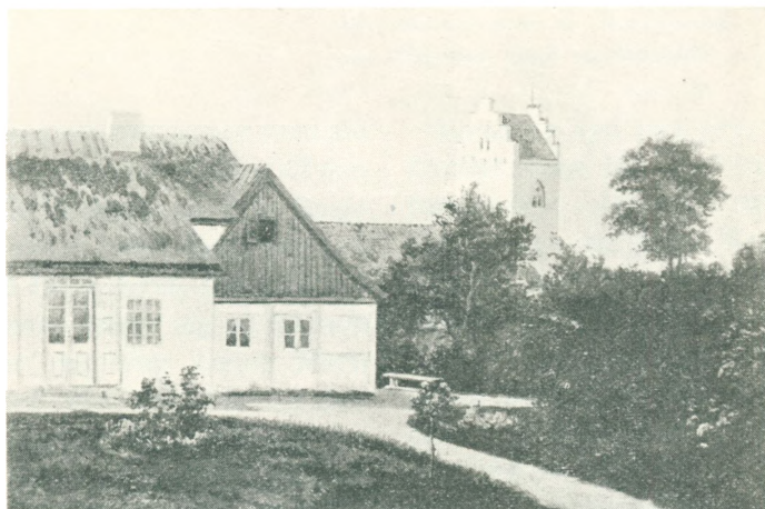
Karlsunde Kirke og gamle Præstegaard.