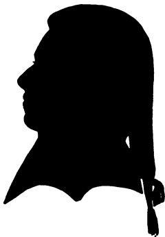
RASMUS TØRSLEFF, Cand. theol. født 1766, død 1796.