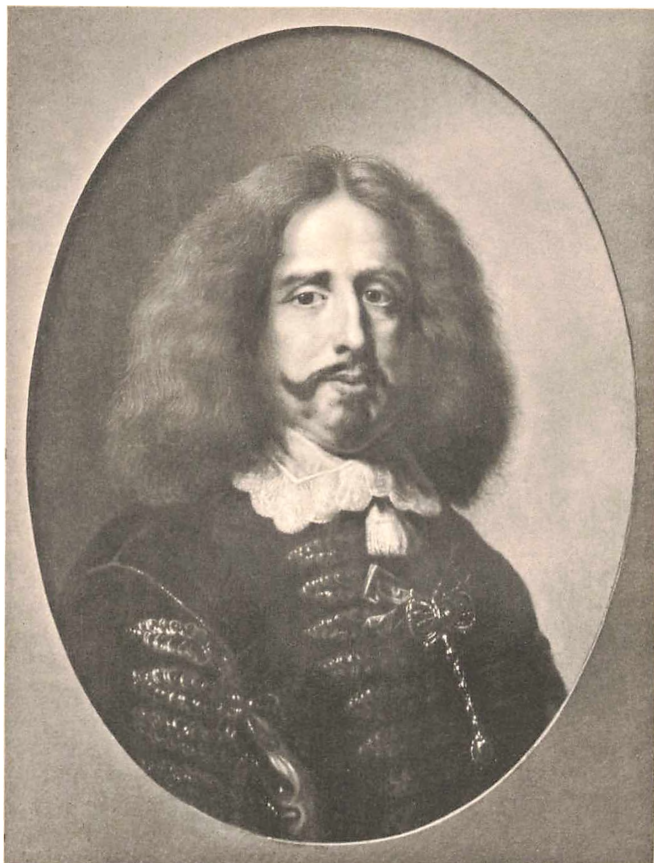
DON BERNARDINO DE REBOLLEDO.