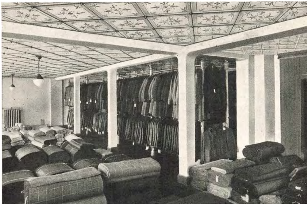
Lager for færdig Konfektion og Klædevarer 2 Sal