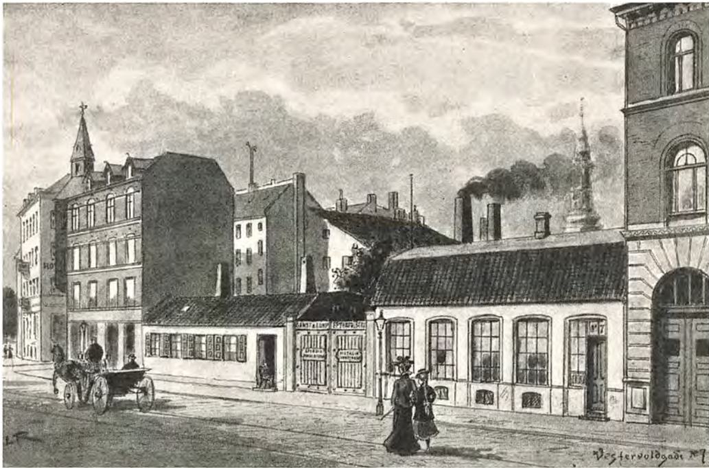
Den ny opførte Ejendom og Ejendommen 7-9 1897

bøjer sig henover Disten og i et Nu er den stakkels Hat trykket saa flad som en Pandeflage.