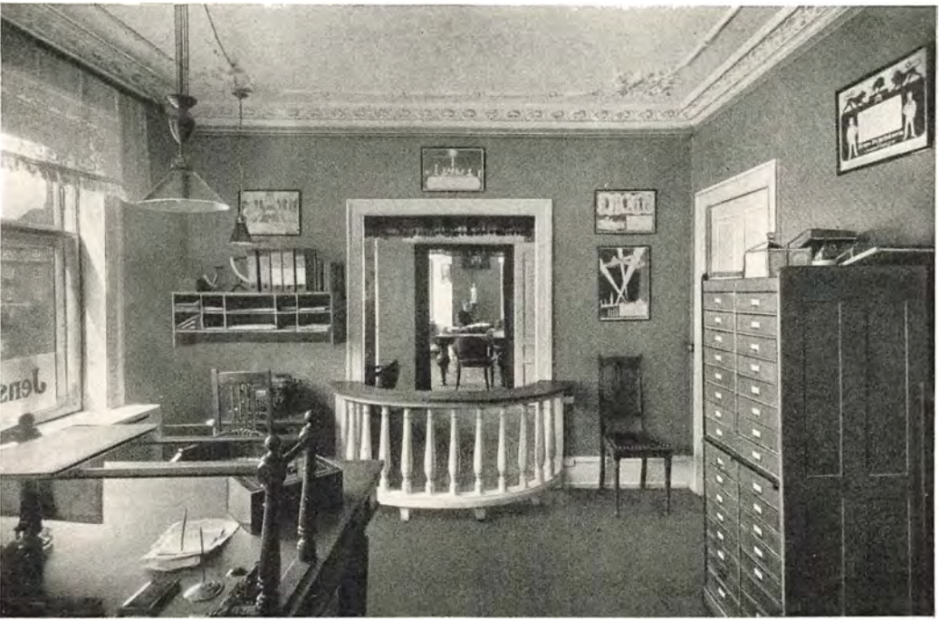
Kontoret 3. Sal