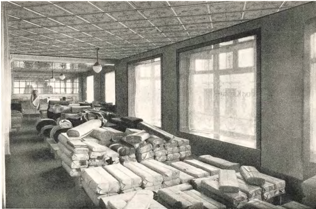
Afdelings Lager af Foersager og Klædevarer 2. Sal

mærke, hvor Løverne symboliserer Kraften og Energien i Firmaet og Bildsvinet den Modstand, der kan møde enhver Forretning.