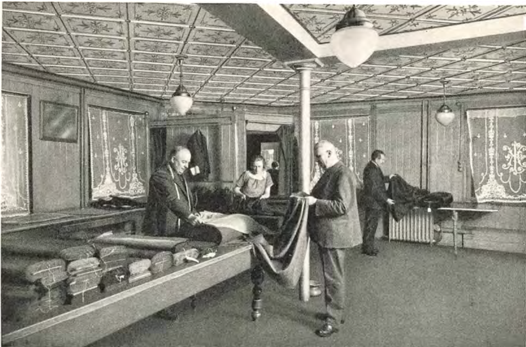
Skræderi Afdelingen Louvre de Paris 2. Sal