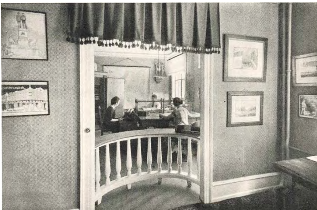
Kontoret 3. Sal