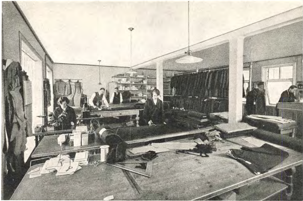
Tilskærersalen 3. Sal

gyldne Bogstaver skulde komme til at staa over en stor og landstendt Forretning, som han selv med sine egne Hænder og ved sin ukuelige Vilieskraft havde lagt Grunden til fra en ganske ringe Begyndelse.