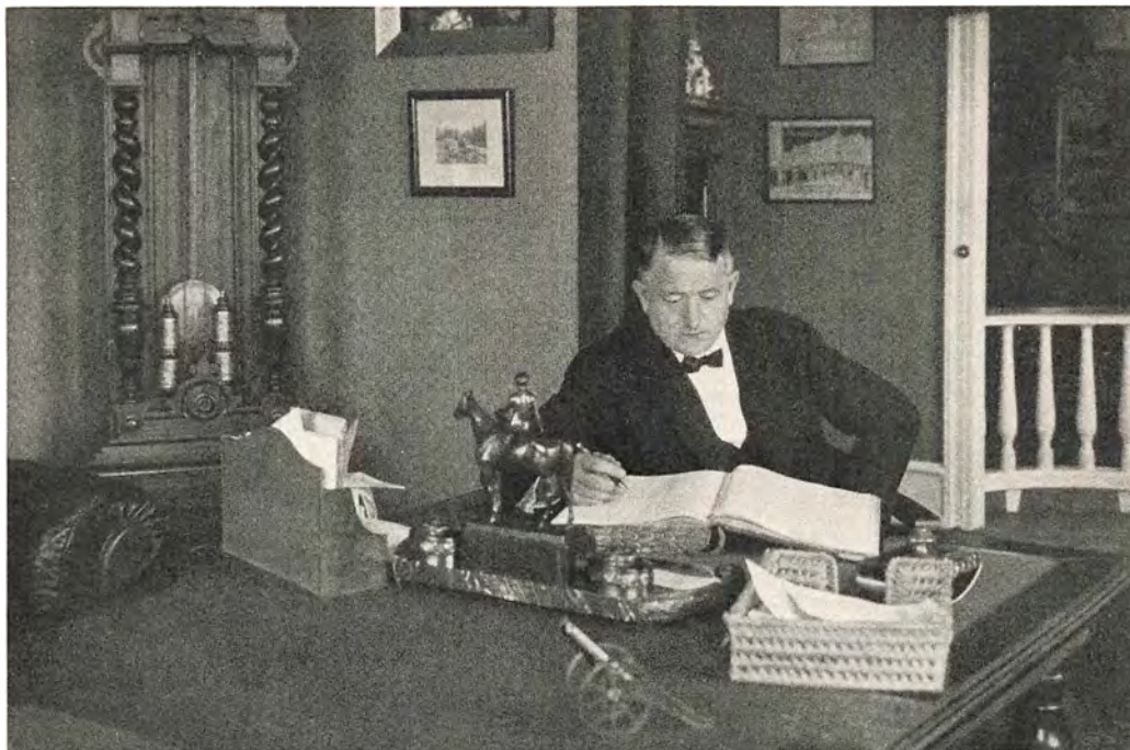
Direktør Kjeldsens Privatkontor