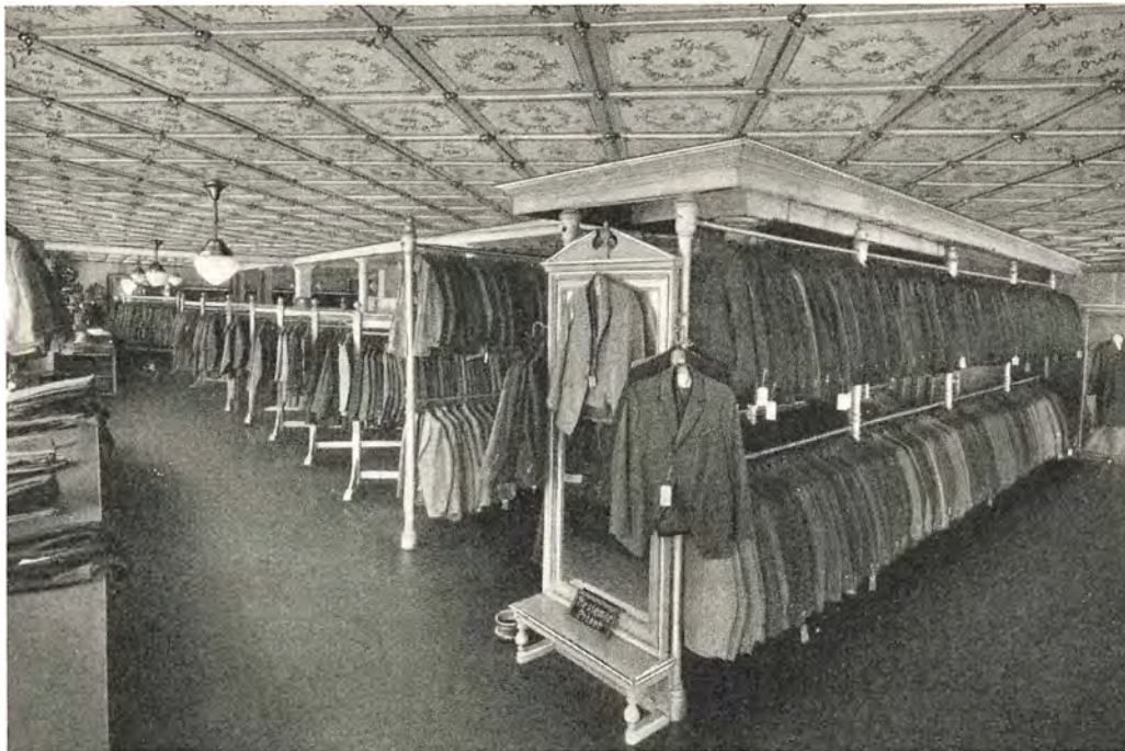
Afdeling for færdig- syet Konfektion 1. Sal

nemlig saa lang han var paa en af Villaens Græsplæner, og vel anbragt her, traf han sin store tykke Lommebog frem af Underlommen. Lommebogen bugnede af Pengefedler, thi han brugte ikke at sætte sine Penge i nogen Bank, da han nærede en vis Mistro til disse ellers saa nyttige og for andre uundværlige Institutioner.