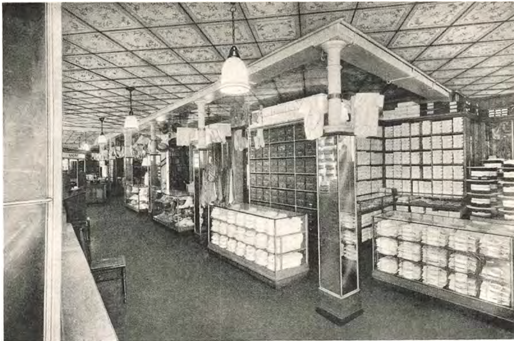
Afdeling for Lin- geri, Stuen

Er der flere endnu, der ikke kender min Forretning? og den 24. Juli s. A.: