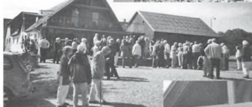
Besøget på Art House af Djursland i Enslev.