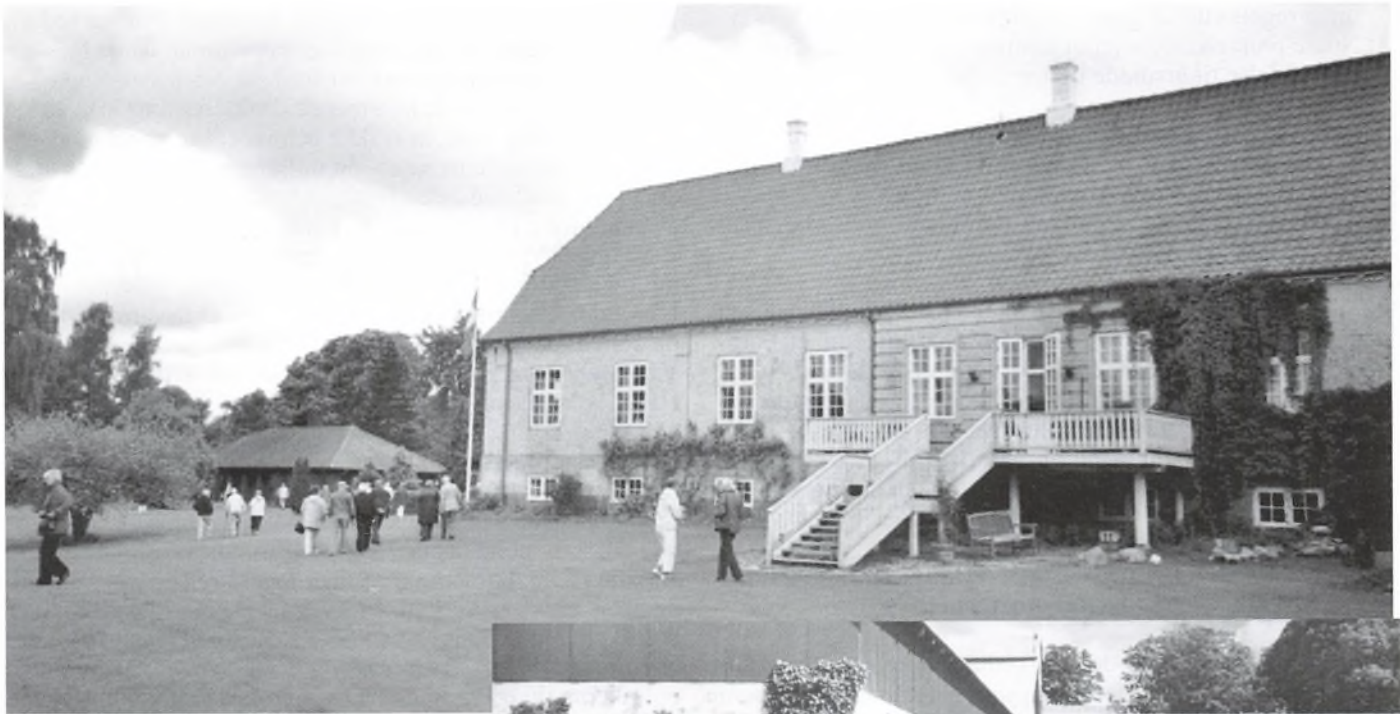
Fra besøget på Lykkesholm.

Turen videre frem førte personbilerne ad en hulvej, der var ufremkommelig for busserne, men vi mødtes på hotellet betids til eftermiddagskaffen og den efterfølgende generalforsamling.