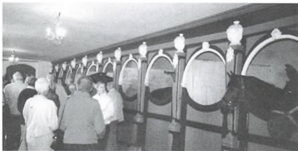
Herskabsstalden. Da både godsejeren og hans hustru rider, har de indrettet den gamle herskabsstald til moderne hestehold med bokse. Nyindretningen er foretaget med stor pietetsfølelse for det gamle interiør. Bemærk, at herskabsstalden har prismelysekroner.