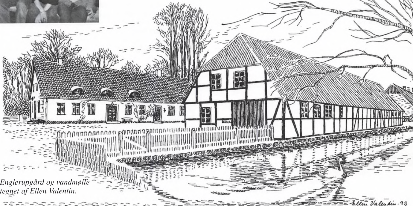
Englerupgård og vandmølle tegnat af Ellen Valentin.

I den lokale tradition fortælles, at egnen omkring Englerup ved Ringsted har været beboet siden 800-tallet, og vikingerne kunne sejle fra Næstved til Haraldsted Sø. Tilmed berettes om en vikingehøvding, Angel, der skulle være begravet i Englerupgårds have, og for at han ikke skal gå igen, er der plantet en hængeask på gravens.