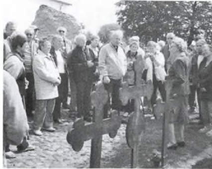
De tre støbejernskors er over familien på Hobballe Mølle, men gravstedet er sløffet, da det efter menighedsrådets og Nationalmuseets opfattelse lå for tæt på Jellingstenene.