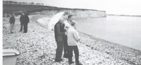
Fra Hjembæk Strand er der udsigt til Sangstrup Klint