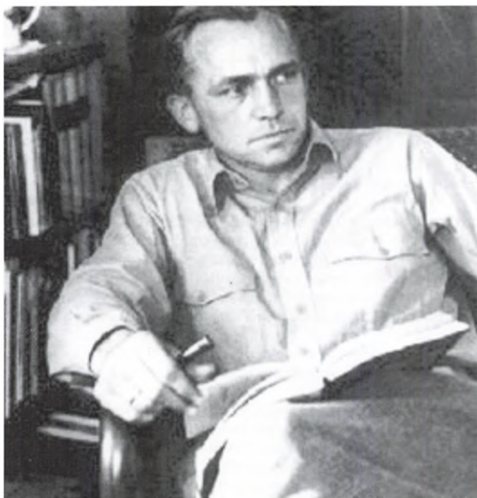
Martin A. Hansen.

Herefter følger "Lykkelige Kristoffer", "Tornebusken", "Agerhønen", "Tanker i en skorsten" og slutter i 1950 med den store radiatoroman "Løgneren".