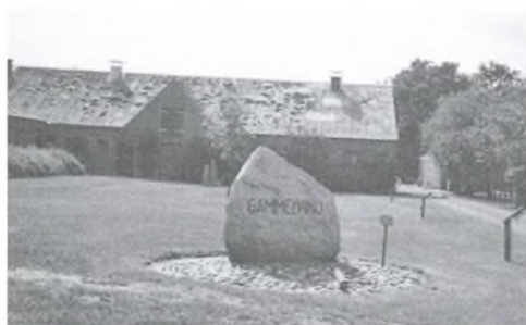
Gammelvind set fra Ørnhøjvej. Bemærk den smukke sten med gårdnavnet.