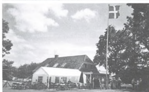
Fra slægtstræffet i haven ved Gammelvind.