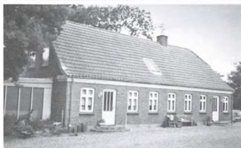
Stuehuset set fra gårdsiden. Opført i 1926.