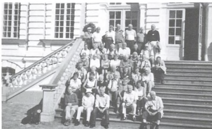
Hele selskabet på hovedtrappen til det smukke barokslot Pils Rundale.