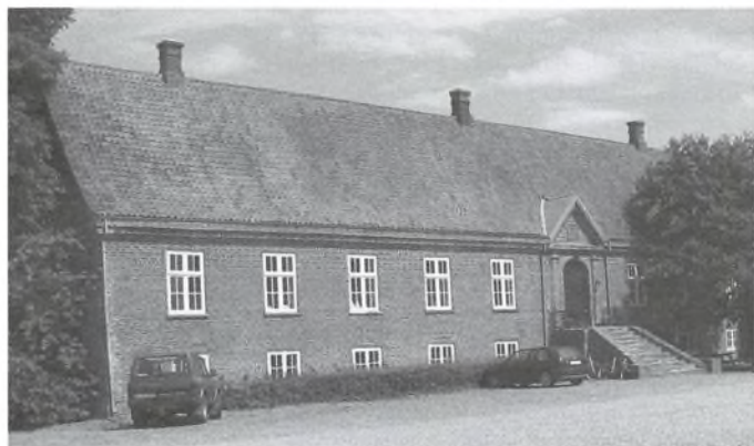
Skerrildgårds hovedbygning fra 1766.

Andre gamle planter på stedet, som de fandt, var Guldnælde, Fladkravet Kodriver, Liden Singrøn, Dorthealilje, Skov-Forglemmigej samt Italiensk og Spansk Skilla.