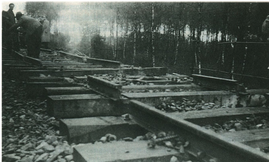
Modstandsbevægelses sprængning af jernbanen i Haslev Orned. Juni 1944.