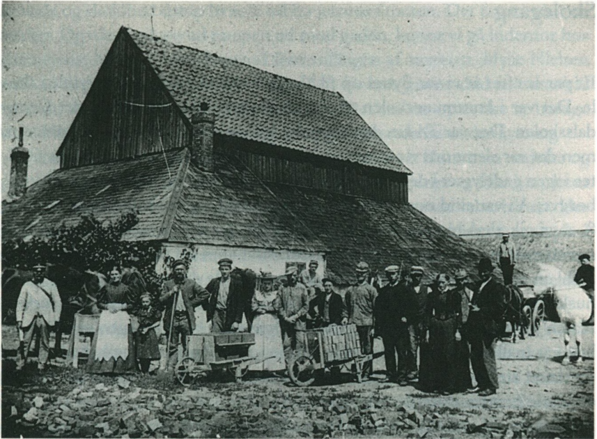
Troelstrup teglværk ved Haslev, hvor jeg blev født 1914.

børn havde tit nok hørt, hvordan patienterne, der alle var kvinder, lå og hostede døgnet rundt for åbne vinduer. Ja, somme tider skreg de hjerteskræende, når de hostede lungerne op i små stykker. Vi gruede, når vi hørte det. Lægerne vidste ikke så meget om den frygtede sygdom, men man gjorde, hvad man formåede, og det var alt for lidt, for ligvognen kom ofte og hentede en, der var bukket under. Der gik en del år, før man fandt kilden til tuberkulosen, det var mælk fra tuberkuløse malkekøer. Så kom der et påbud fra staten om, at ingen mælk måtte forhandles ubehandlet, og alle køer skulle regelmæssigt kontrolleres af en dyrlæge, og hvis der var syge dyr, så skulle de straks slæes ned, og staten ville betale omkostningerne. På den måde fik man sygdommen under kontrol.