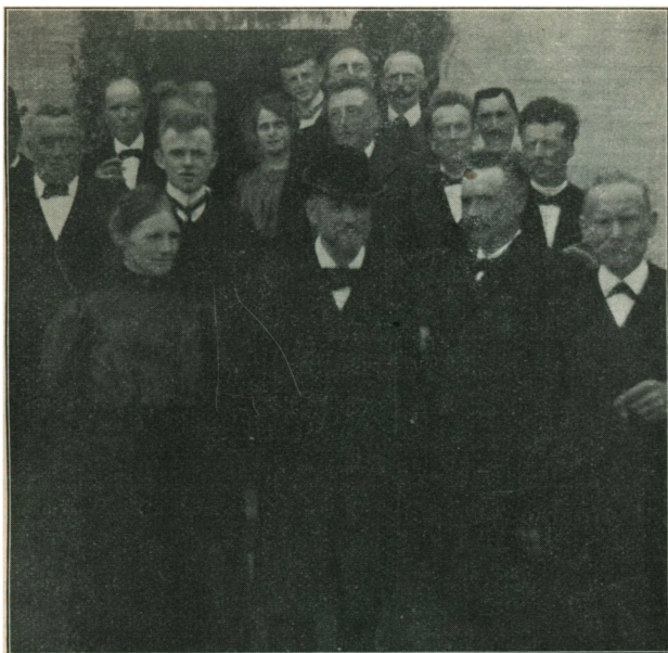
Sølvbryllupsgæster i Bringstrup d. 9. September 1906. I Forgrunden Sølvbrudeparret.