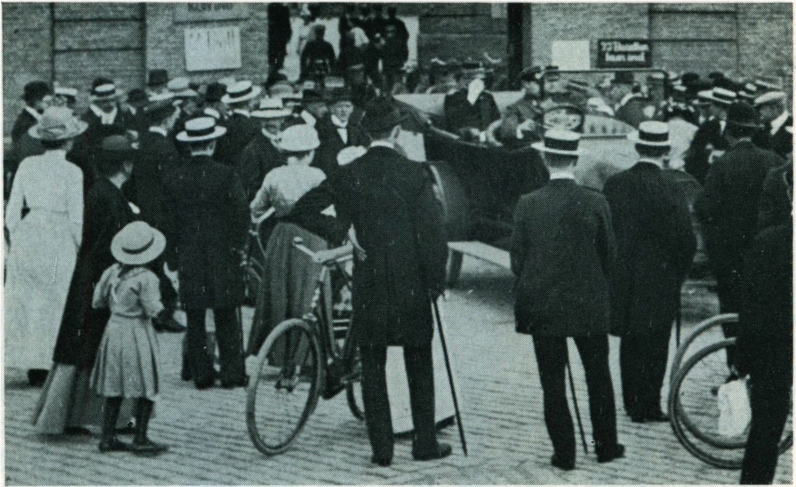
Kong Christian X forlader Sølvgades Kaserne efter en inspektion