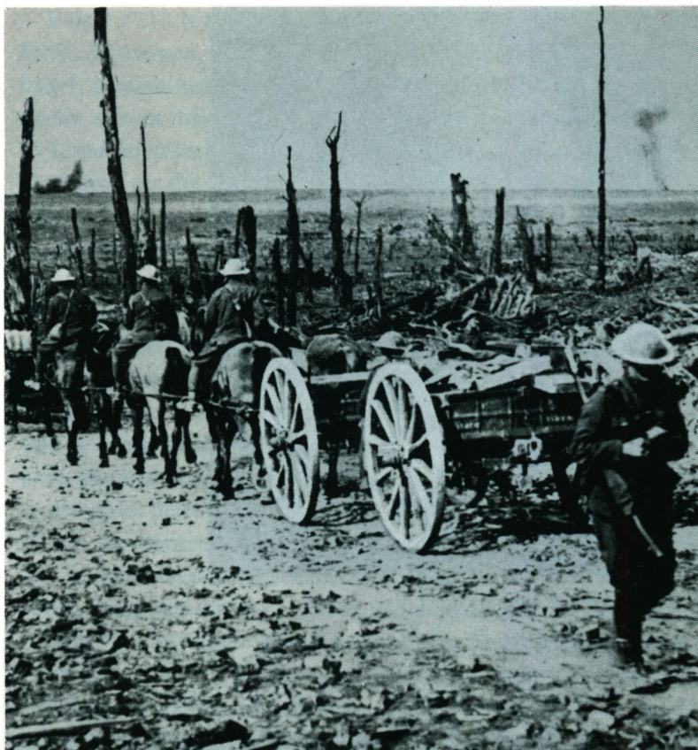
Britiske tropper på vej gennem sønderskudt terræn på Vestfronten