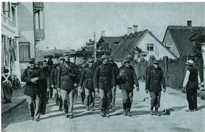
En deling af den danske sikringsstyrke på march gennem Skovshoved-idyl til vagttjeneste ved Øresundskysten