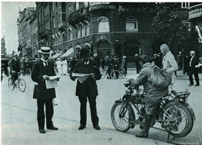
Avisernes ekstraudgaver om krigsudbruddet 1914 studeres på Rådhuspladsen i København