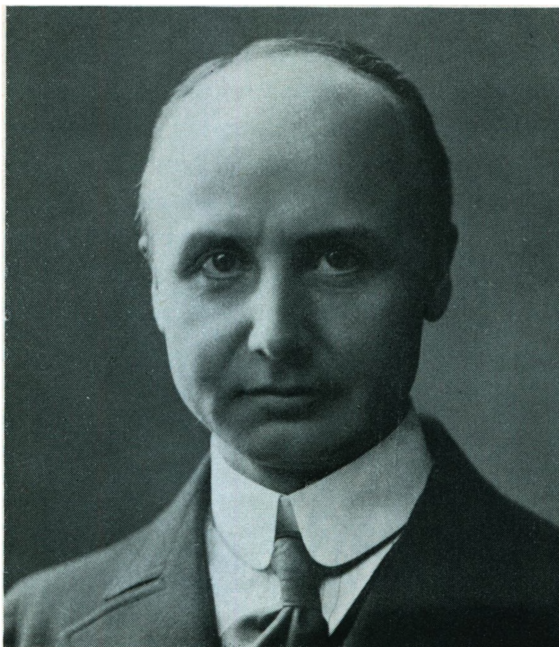
Eric Scavenius – foto fra 1914