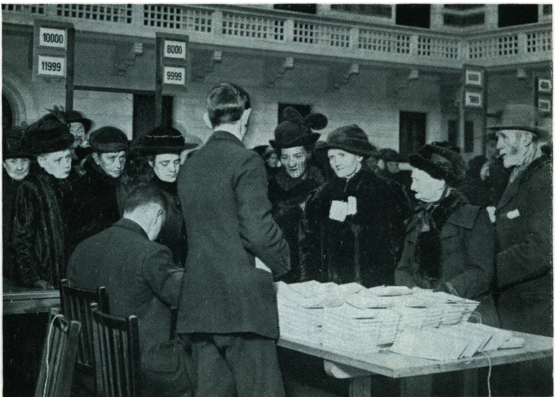
På Københavns rådhus uddeles rationeringsmærker på grund af den stadig mere skærpede forsyningsituation