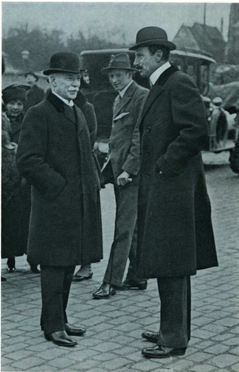
Ved hjemkomsten fra Slesvig-forhandlingerne i Paris blev delegationen modtaget af Kongefamilien. Her ses Kong Christian X i samtale med etatsråd H. N. Andersen – og bagved Prins Knud