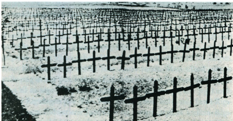
På fronterne i Vest og Øst vidner stadig flere massegrave om den blodige krigs ødelæggelser og tab. Her tyske soldatergrave i Flandern