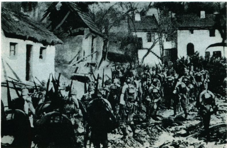
Tysk infanteri drager gennem hærgnet landsby på Østfronten