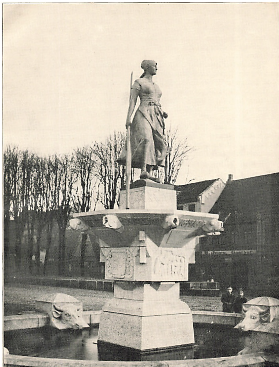
DAS ASMUSSEN-WOLDSSEN-DENKMAL IN HUSUM