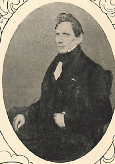
JOHAN NICOLAJ WOLDSSEN, Dän. Generalkonsul in Amsterdam, * 28/11 1794 in Husum † 9/: 1872 in Amsterdam