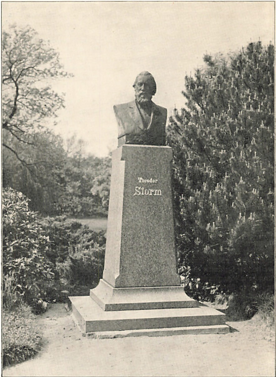
DAS STORM DENKMAL IM HUSUMER STADTPARK