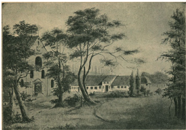
Kirkepladsen i Sorø og Hovedbygningen under Opførelse i 1825. Maleri af Augusta Stemann.

den departementale Følelseløshed overfor disse ulykkelige Menneskers hele Velfærd. Det er, som om man ser en ond Person med en Kæp rode op i nogle stakkels værgeløse Dyrs fattige Rede — de løber fortvivlede og pibende omkring, aldeles uforstaaende overfor denne ufattelige Ubarmhjerlighed, der jager dem bort fra det eneste Sted i Verden, de bryder sig om. Det forekommer den, der skriver disse Linier, at være længe siden, han i dansk Personalhistorie har læst noget lignende i