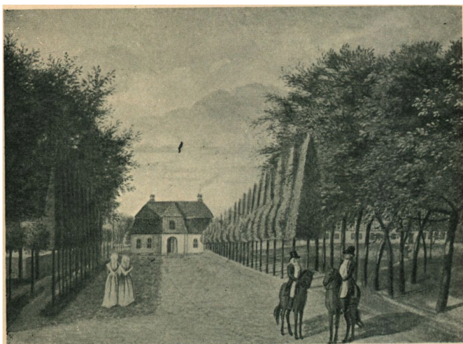
„Molbechshus“ c. 1790. Akvarel tilhørende Sorø Skole.