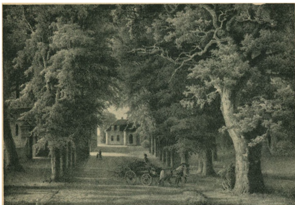
Alléen ved Klosterporten i Sorø. I Baggrunden „Molbechshus.“