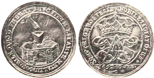
En Alkymistmedaille fra Kristian d. 5.'s Tid.

Kunst er blevet fast („Mobile quod fuerat nunc fixum est arte metallum“). Kataloget tilføjer: „I Anledning af et ved en fremmed indkommen Chymistens i Kongens Nærværelse gjorde Forsøg med at frembringe Guld og Sølv af Kvægsølv er denne Medaille præget“.